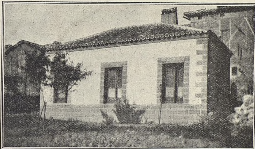
LA NUEVA CAPILLA EVANGÉLICA EN ARENAS DE SAN PEDRO

Satanás puede muchísimo contra nosotros, cuando estamos solos, pero no puede nada cuando estamos con Cristo. Y como Cristo está atento al llamamiento del hombre; como Cristo está invitando a todos los que están trabajados y cargados para que vayan a Él; como Cristo, no sólo quiere, sino que Él mismo llama a nuestras puertas; si queremos ser de Cristo, Cristo hará en nosotros lo que nosotros no podemos, y exclamaremos en medio de nuestra impotencia y desesperación como exclamaba San Pablo: «Gracias a Dios que nos da la victoria por el Señor nuestro Jesucristo».