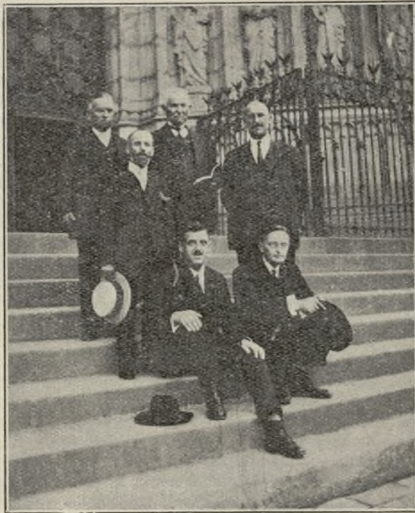
EN LA ESCALINATA DE LA CATEDRAL DE BARCELONA

Los argelinos y marroquíes abandonan sus rancias creencias, no se asustan de tomar trenes y vapores, sustituyen con autos sus mulas y aun sus burros y procuran aprender el francés o el español. El turco abandona el fez y la poligamia, suprime el Califato y abrevia el Ramadán. El persa depone a su Shah, proclama como rey al primer ministro y empieza a