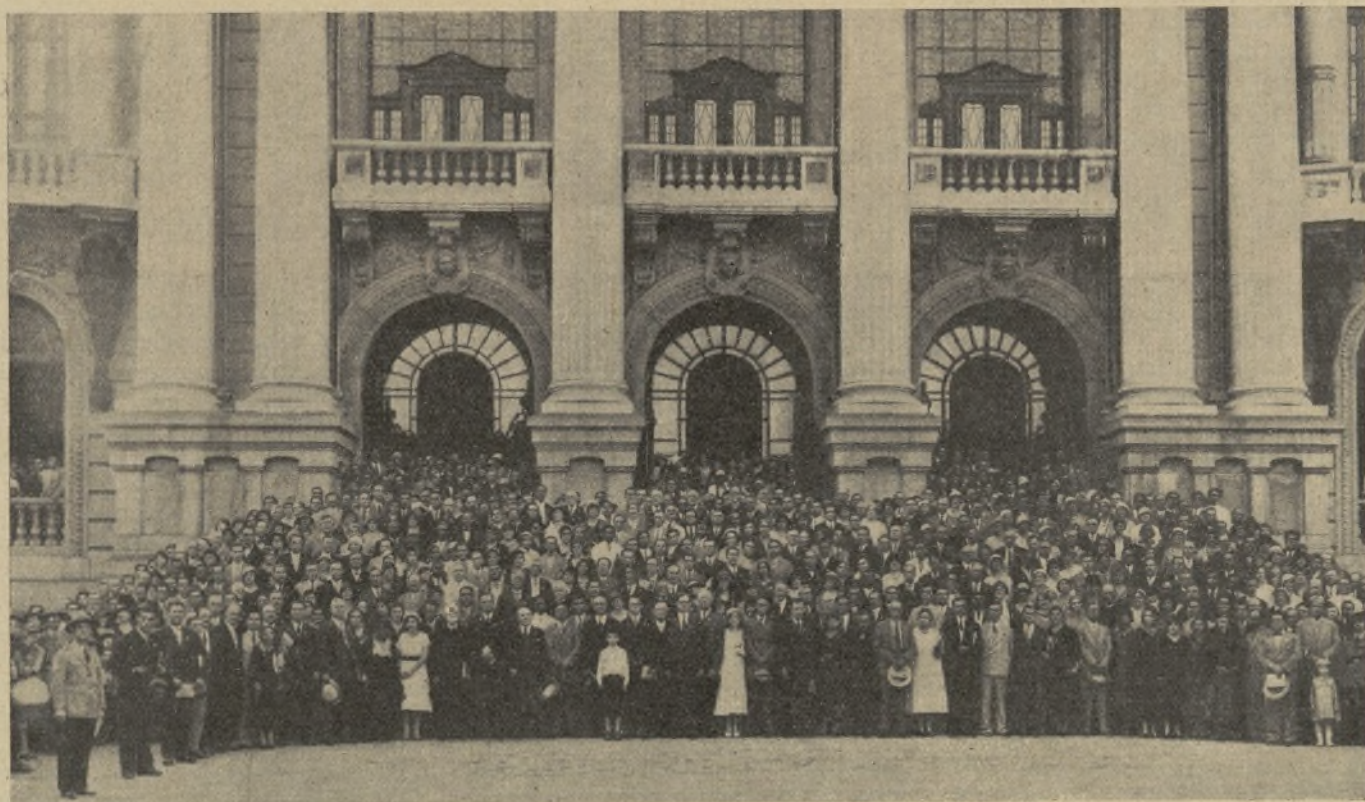
Delegados a la Convención de Río de Janeiro, al salir de una de las reuniones celebradas en el Teatro Municipal de la bella capital brasileña.

N O podían los organizadores de la XI Convención Mundial de Escuelas Dominicales hallar marco más adecuado para realizar su empresa que la hermosa ciudad de Río de Janeiro, por cuanto además de sus bellezas naturales cuenta también la ciudad con potentes organizaciones evangélicas, con millares de miembros y espléndidos edificios.