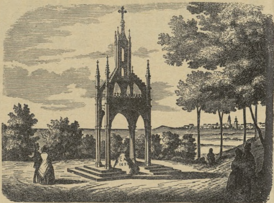
Monumento a Gustavo Adolfo, en Lützen.

El gran cimiento para su reputación estaba firmemente colocado. Como un águila voló el héroe por toda Alemania, pasó el Rhin venciendo a las huestes españolas en Oppenheim y obligándoles a retirarse a Maguncia. ¡Triste espectáculo el que nos ofrece la Historia al hallar a nuestros compatriotas entregados al servicio del Papa y derramando su sangre por la causa del fanatismo romano! Tilly