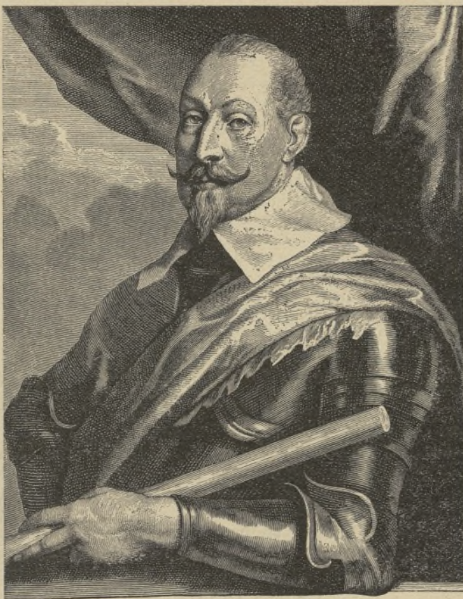
GUSTAVO ADOLFO, REY DE SUECIA

Una de las muchas pruebas de ello son aquellas palabras que dirigió al Parlamento de Suecia: «... Invoco el testimonio del Altísimo, ante cuya presencia estoy, que no marché a la guerra por propio capricho o gusto de guerrear, sino viéndome obligado a ello. . . Nuestros vecinos nos piden socorro; más allá, otros correligionarios, requieren nuestra ayuda, para librarlos del yugo de la esclavitud religiosa en que se encuentran. . . Sólo por la misericordia de Dios, en oración y súplica, podremos extirpar de raíz tanta desgracia. Amonesto a todos y cada uno de nosotros