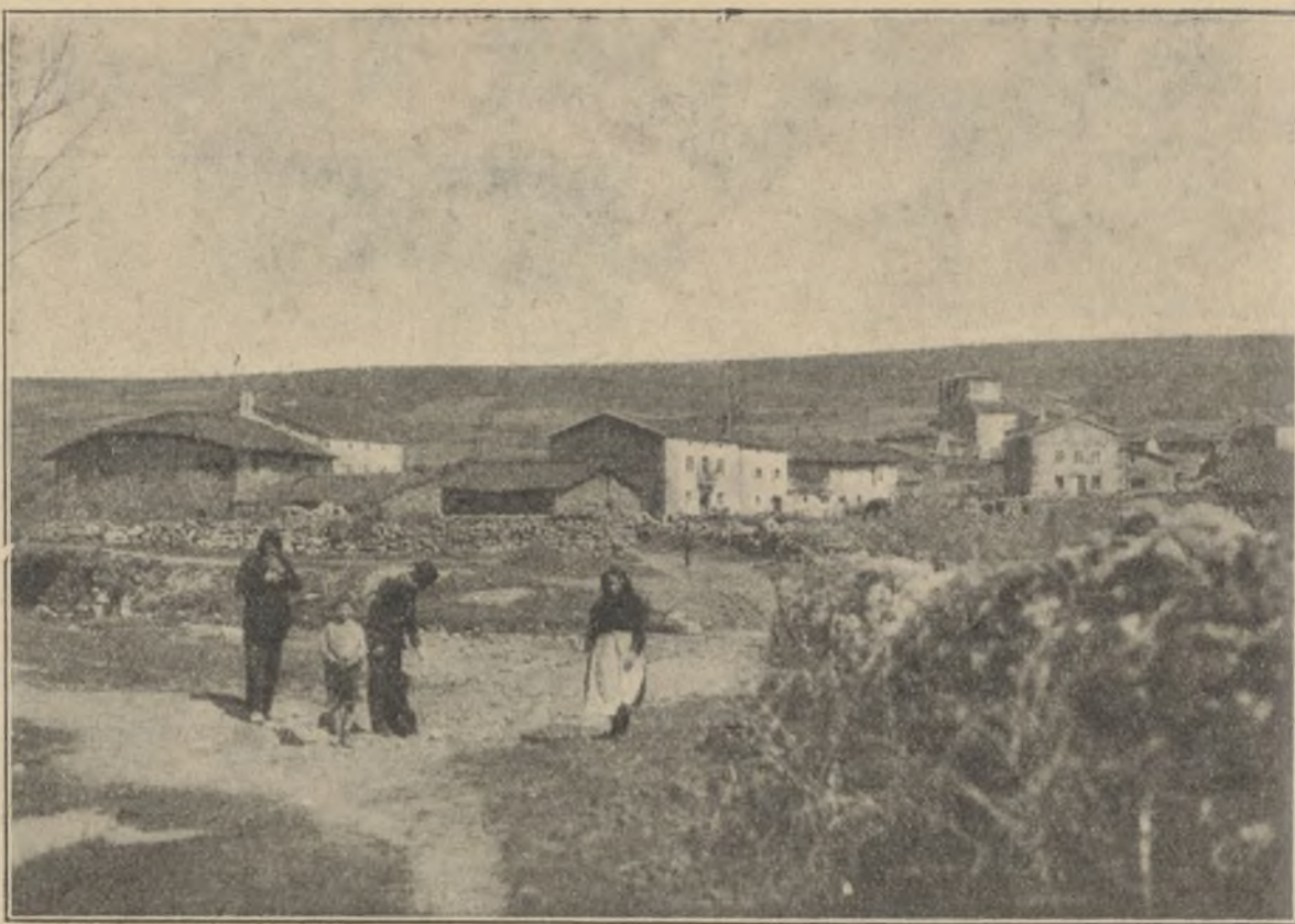
El tranquilo pueblo de Mozoncillo de Juarros.