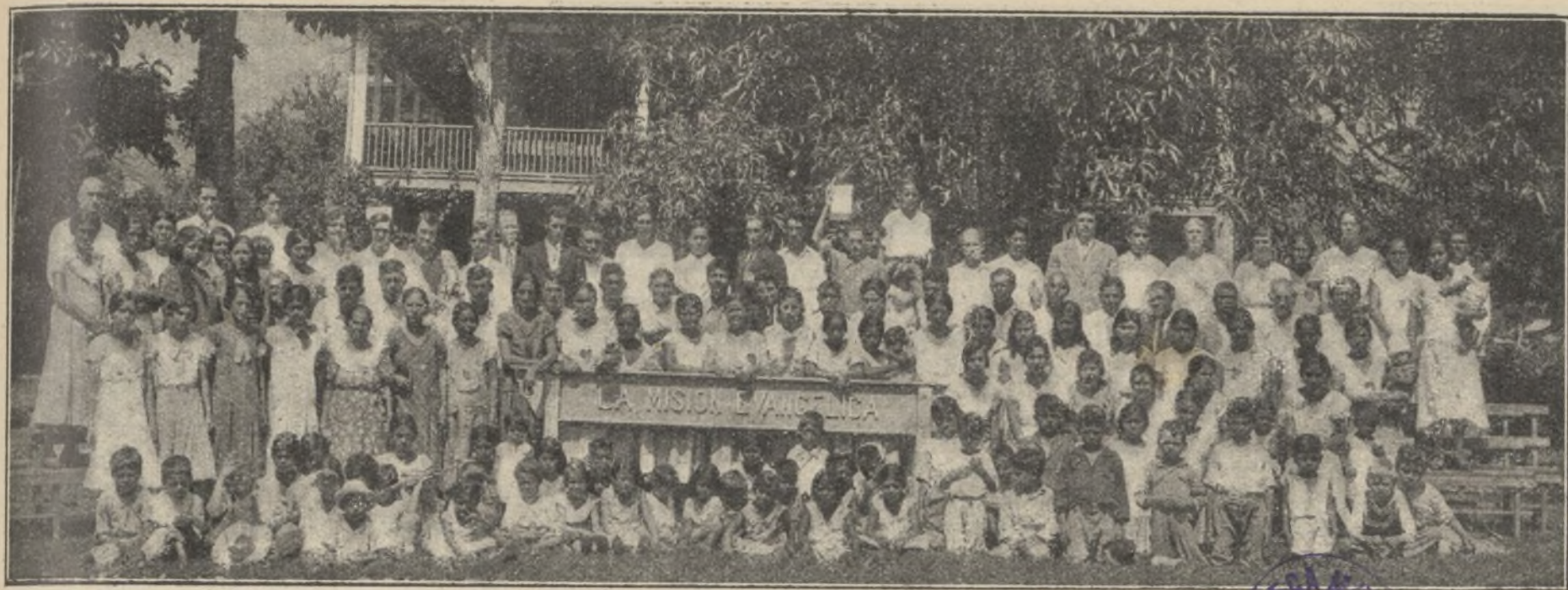
Conferencia Evangélica en San Pedro Sula (Honduras).