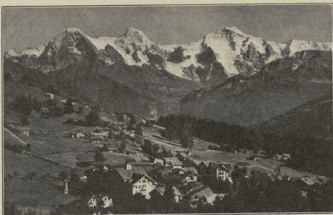
Alrededores de St. Beatenberg. Al fondo, los Alpes.

de las montañas suizas comprenderán la emoción que causan al que por primera vez contempla una de las obras más bellas del Creador. Desde Thun nos trasladamos en un vaporcito a Beatenbuch. ¡Cuánta belleza encierra este lago! Desparramados en sus dos orillas sin apenas solución de continuidad están situados infinidad de pueblos, cuyos chalets típicos, rodeados de jardincitos, ascienden por las laderas de las escarpadas montañas pobladas de abetos hasta grandes elevaciones. Hasta Beatenberg se llega por un funicular en ascensión empinadísima, hasta alcanzar más de los 500 metros sobre el nivel del lago. Una vez en Beatenberg, el panorama es simplemente magnífico. Al pie de la aldea, el bello lago con los pueblecitos que le rodean, y al frente los majestuosos Eiger, Monch y Jungfrau, con sus cimas cubiertas de nieves perpetuas.