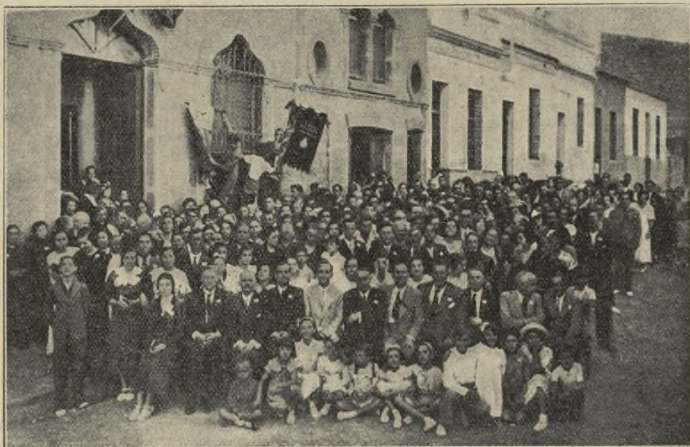
Concurrentes a la Convención de Tarrasa.

D. Samuel Vila expuso su plan para proveer fondos para la edificación de templos y llevar adelante la obra de evangelismo, el cual consiste en crear sellos de contribución voluntaria mensual, y admitir préstamos con interés. Esta proposición obtuvo tan buena acogida de la mayoría de los convencionistas que una semana después se habían recibido ofrecimientos de cuotas