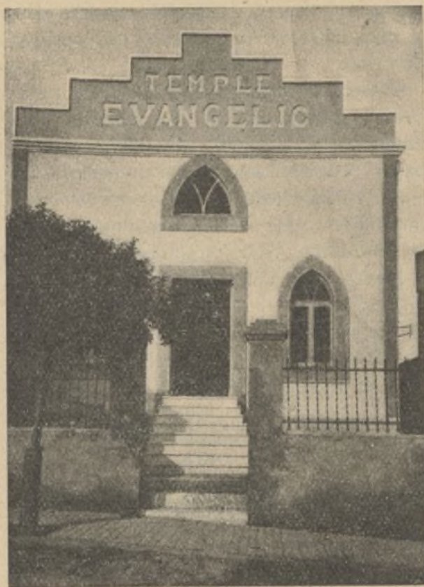
El nuevo templo de Badalona.

No terminaremos esta breve reseña, sin expresar al "Comité Internacional para Evangelización en España", nuestra cordial gratitud por el interés que siente por el Seminario y por el generoso apoyo que le presta.—E. A.