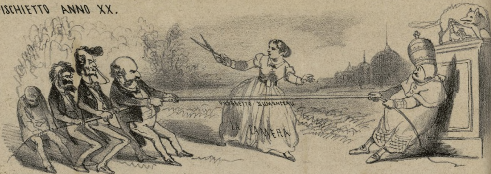
Chi troppo la tira ..... va a gambe in aria.