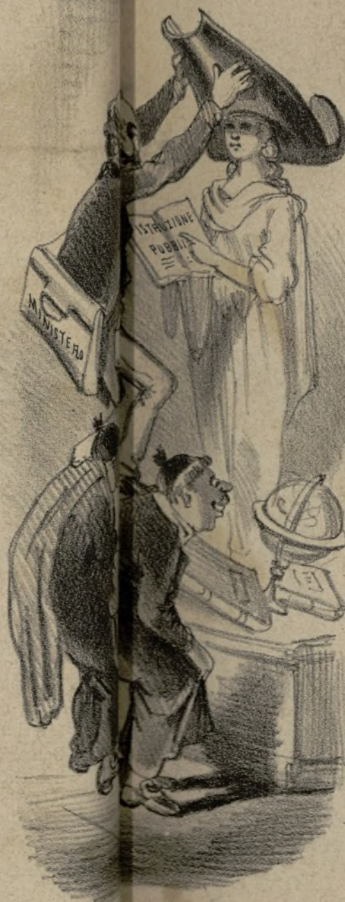
E monsignor si approfittava della generale preoccupazione per terminare tranquillamente il suo lavoro.