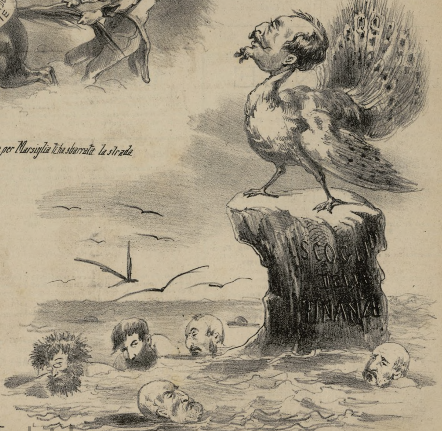
Dall'alto di questo scoglio vedo precipitati gli inetti che mi hanno preceduto: non cadono i nostri noi che siamo far approvare la tassa sul macino, e combinate il contratto dei tabacchi.