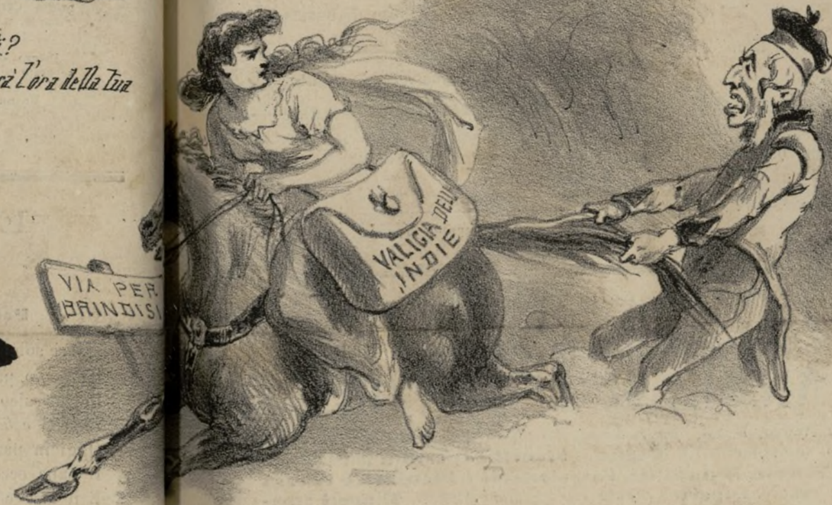
Goddam! Non si può che ti vorrebbe veder passare per Marsiglia ti ha sbarrata la strada che corri per tornare.