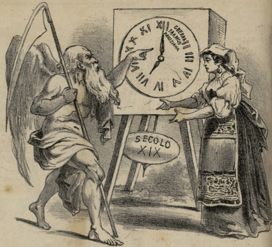
Quando cesserò io dal trovarmi in balia dei preti? Pazienza figliuola mia, e più presto che non credi suonerà l'ora della tua emancipazione.