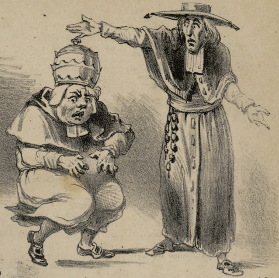
Ebbene, è giunto il bastimento che doveva portar nuove truppe di Francia? Il bastimento è giunto, ma... ma sta imbarcando a Civitavecchia cavalleria e cannoni per retrocedere a Marsiglia.