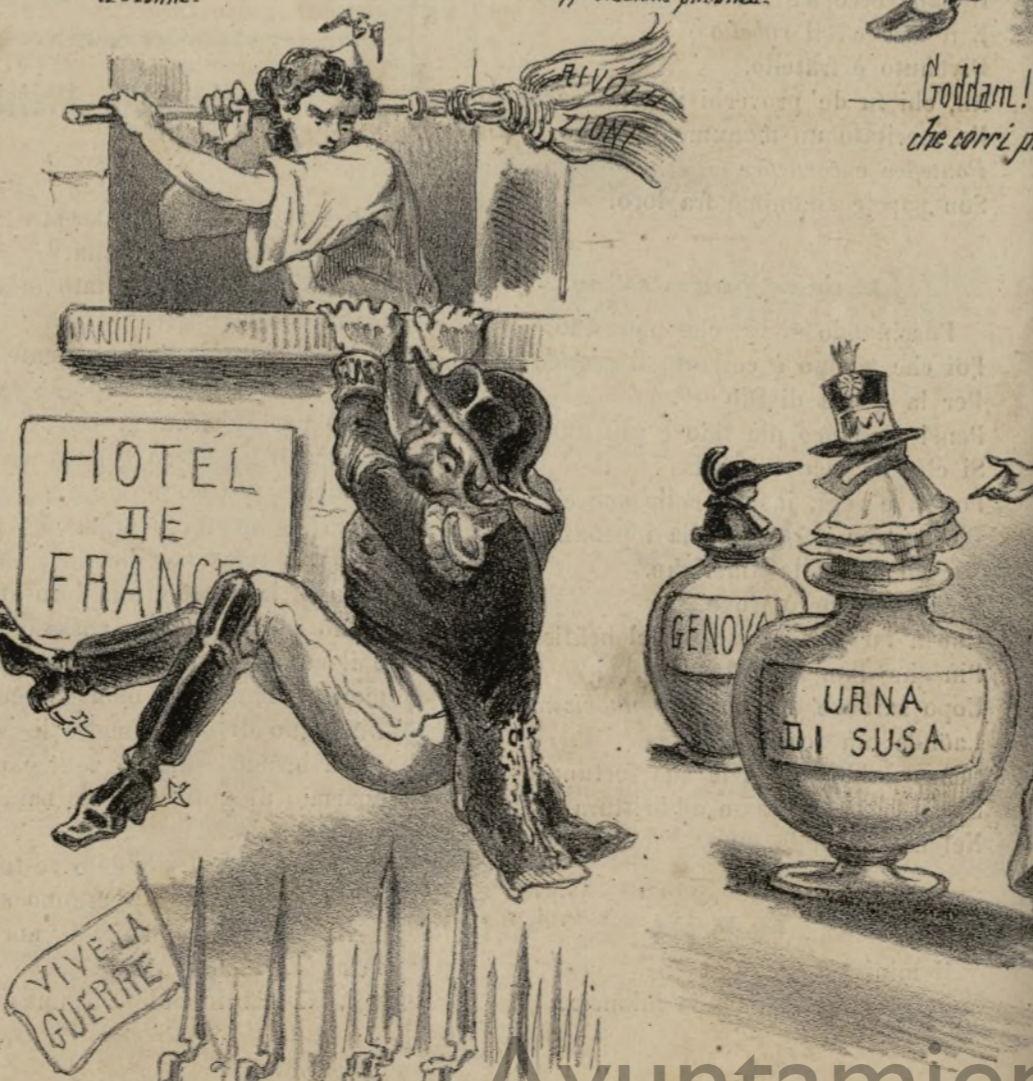
La posizione è inimitabile: pericoloso il gettarsi giù, pericoloso il tornar dentro.