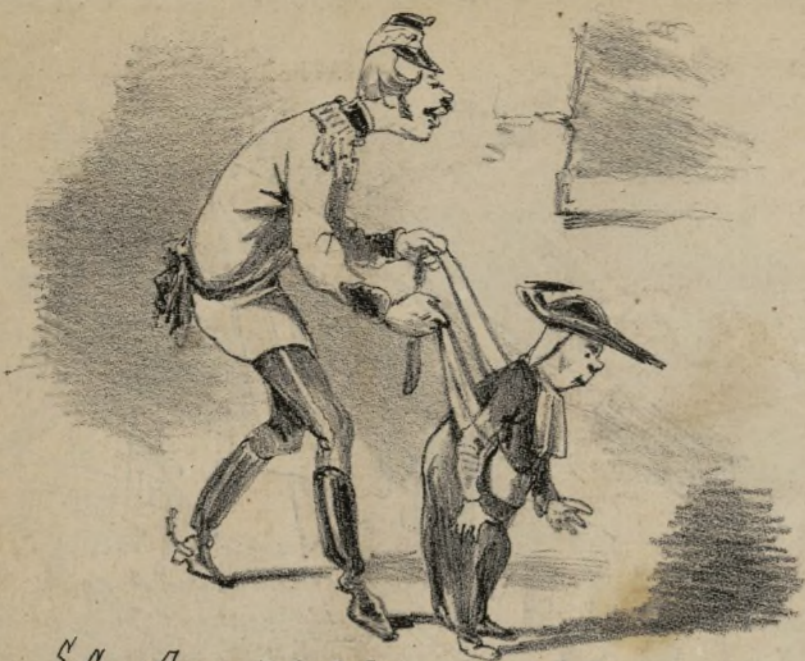
Se Cecco Beppe sta dando lezioni ai preti di Vienna...