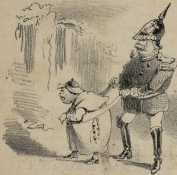
Giuglielmo festeggiando l'utero a Worms cerca mettere il papa sui passi del puro vangelo.