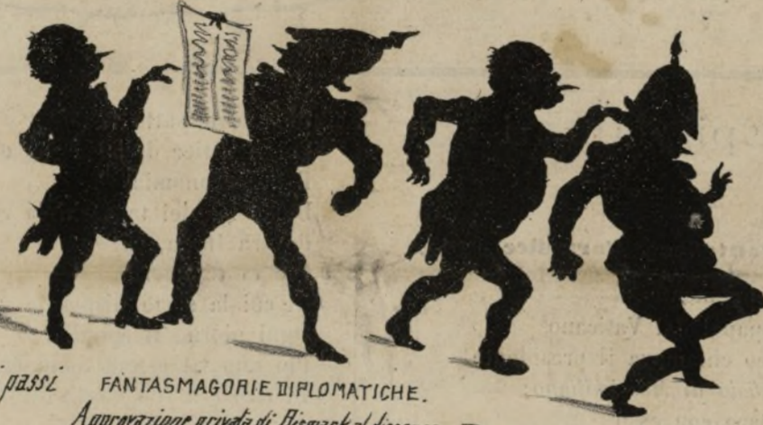
FANTASMAGORIE DIPLOMATICHE. Approvazione privata di Bismark al discorso di Moltke. Disapprovazione pubblica.