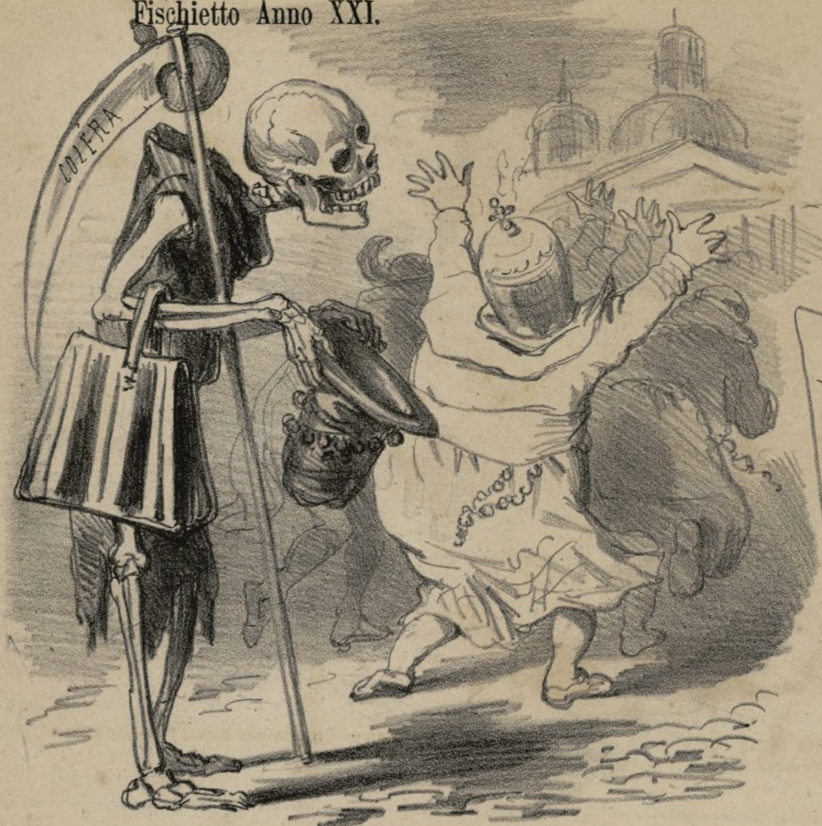
L'instancabile pellegrino ha voluto anche lui andar a baciare la pantofola dell'invitto Pio IX. Che sia anche questo un miracolo del dito di Dio?