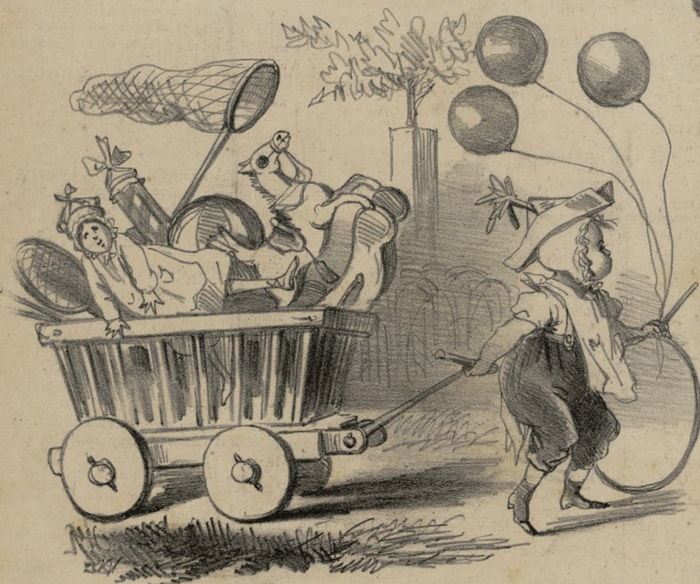
Nostre informazioni ci mettono in grado di affermare, che il principe Milano lavora alacremente per far felice i suoi sudditi.