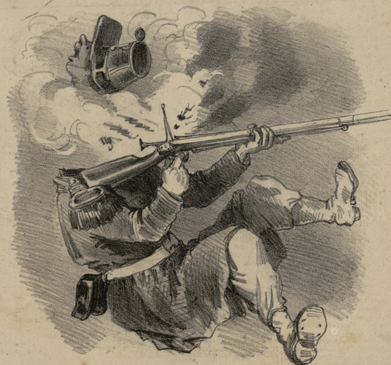
Vista la straordinaria perfezione dei nuovi fucili ad ago, ed il bisogno di economie, il ministero s'è indotto ad armarne anche la marina.