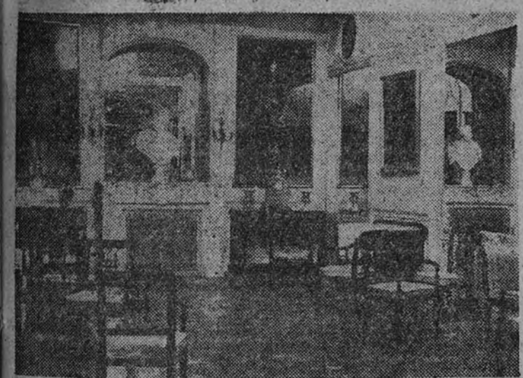
Antecámara del despacho oficial de la nueva residencia del Jefe del Estado, Generalísimo Franco.

EL CADAVER DEL GENERAL EN LA ESTACION DE ATOCHA