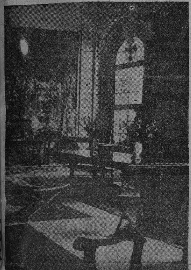
Vista parcial del salón de Consejo de la nueva residencia de S. E. el Jefe del Estado.