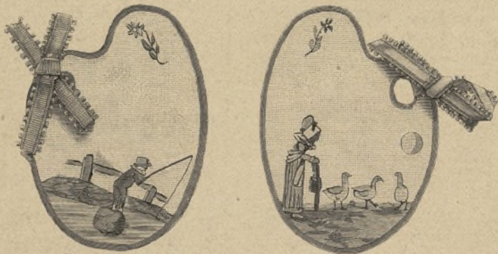
Selbstgemalte Tischkarten. Zwei Drittel natürlicher Größe.