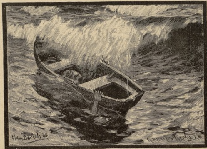
... es kippt, — es stürzt, — ein dumpfer Laut, und der Wind fuhr klagend über die Stätte . . .

„Oder Nutzen,“ entgegnet der Alte, mit den schlauen Augen blinzeln. „Lebt wohl nicht Jeder vom Sonnenschein und Fische fangen.“