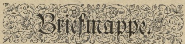
Nachdruck auch im Einzelnen verboten.