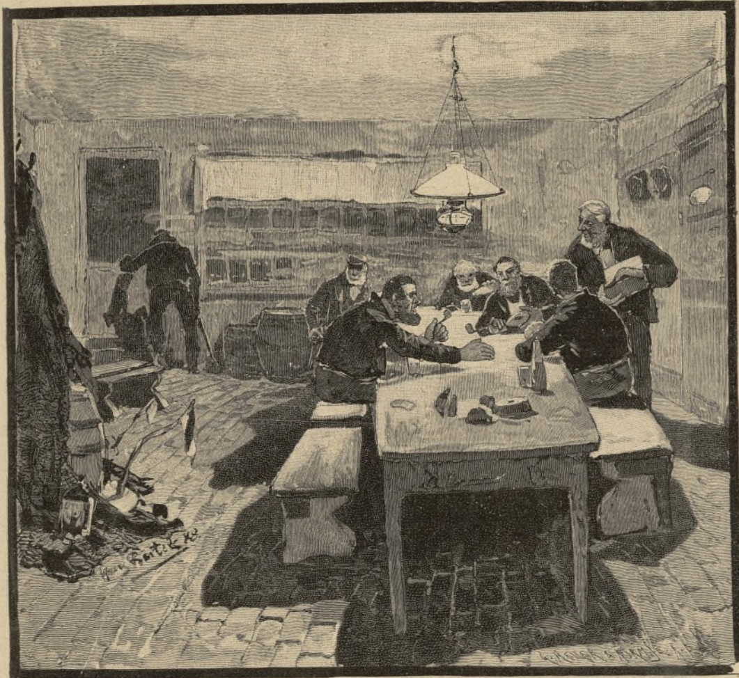
Niemand merkt, daß der Malte leise aufsteht und fortgeht . . .