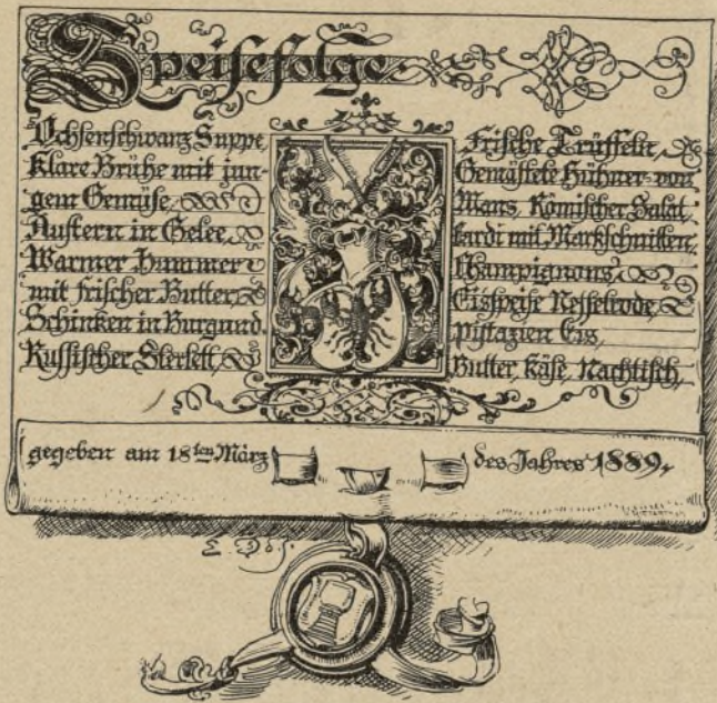
Speisenfolge in Urkundenform, gerollt und offen, zur Ausführung auf Pergament. Nach einer Zeichnung von E. Dopler d. J. Halbe natürliche Größe.