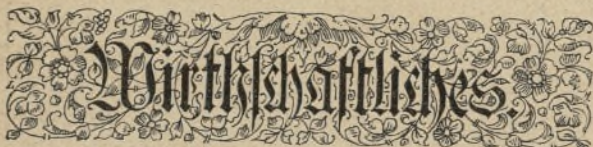
Nachdruck auch im Einzelnen verboten.