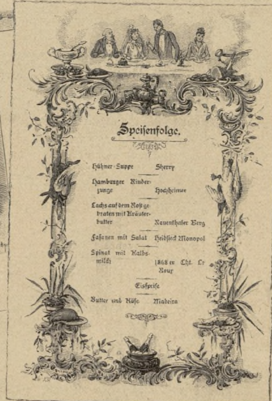
Zwei Speisenfolgen auf vorgegedruckten Karten.

sich noch der stolzen Schwäne mit langgezogenem Halse, der Bischofsmützen, Kaiserkronen und glückbringenden Schiffe, zu denen das weiße Sinnen geformt wurde, vor dem vornehmsten Gaste in stolze Höhe prangend? Heute sind wir geneigt, über diese Meisterstücke des Geschmacks zu lächeln, sie eine Verirrung zu nennen, ja, wir finden es eigentlich unappetitlich, ein Mundtuch zu gebrauchen, das — von wer weiß, welcher Hand, — gebrochen, gedreht, geknüpft und seiner ursprünglichen Frische beraubt wurde. Heute ziehen wir den unberührten Seidenglanz des Damastes vor, der — oft mit wundervoll ausgeführtem Monogramm des Besitzers geschmückt, — unseren Teller deckt, oder wir freuen uns des farbig mit Garn, Seiden- und waschbaren Goldfäden gestickten Tuches, dem eine geklöppelte Spitze den Abschluß giebt.