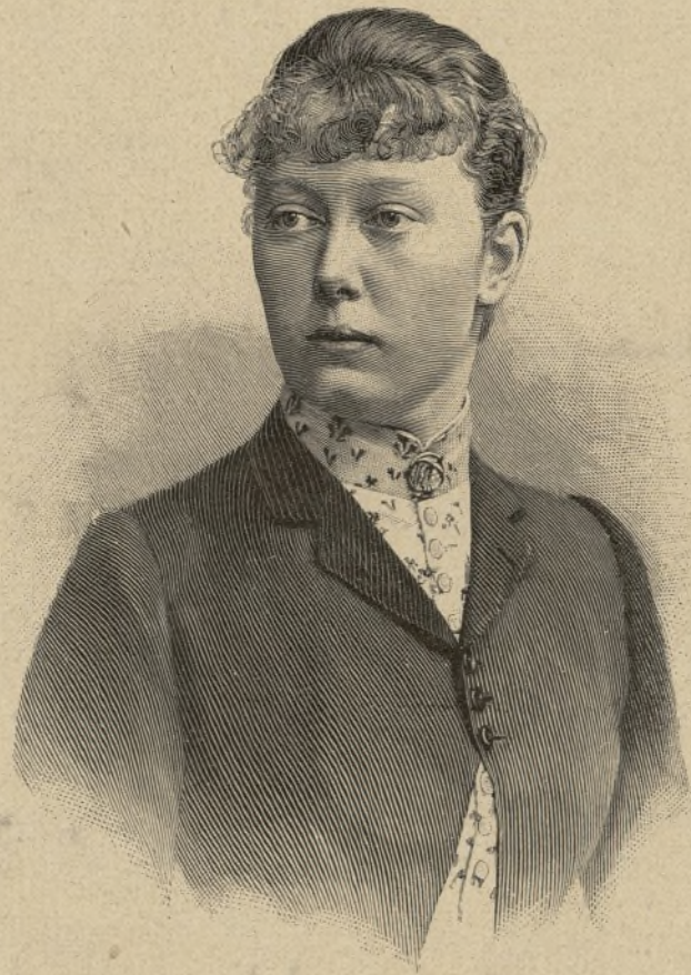
Erbprinz Friedrich von Anhalt und seine Brant, Prinzessin Marie von Baden. — Siehe Seite 55.