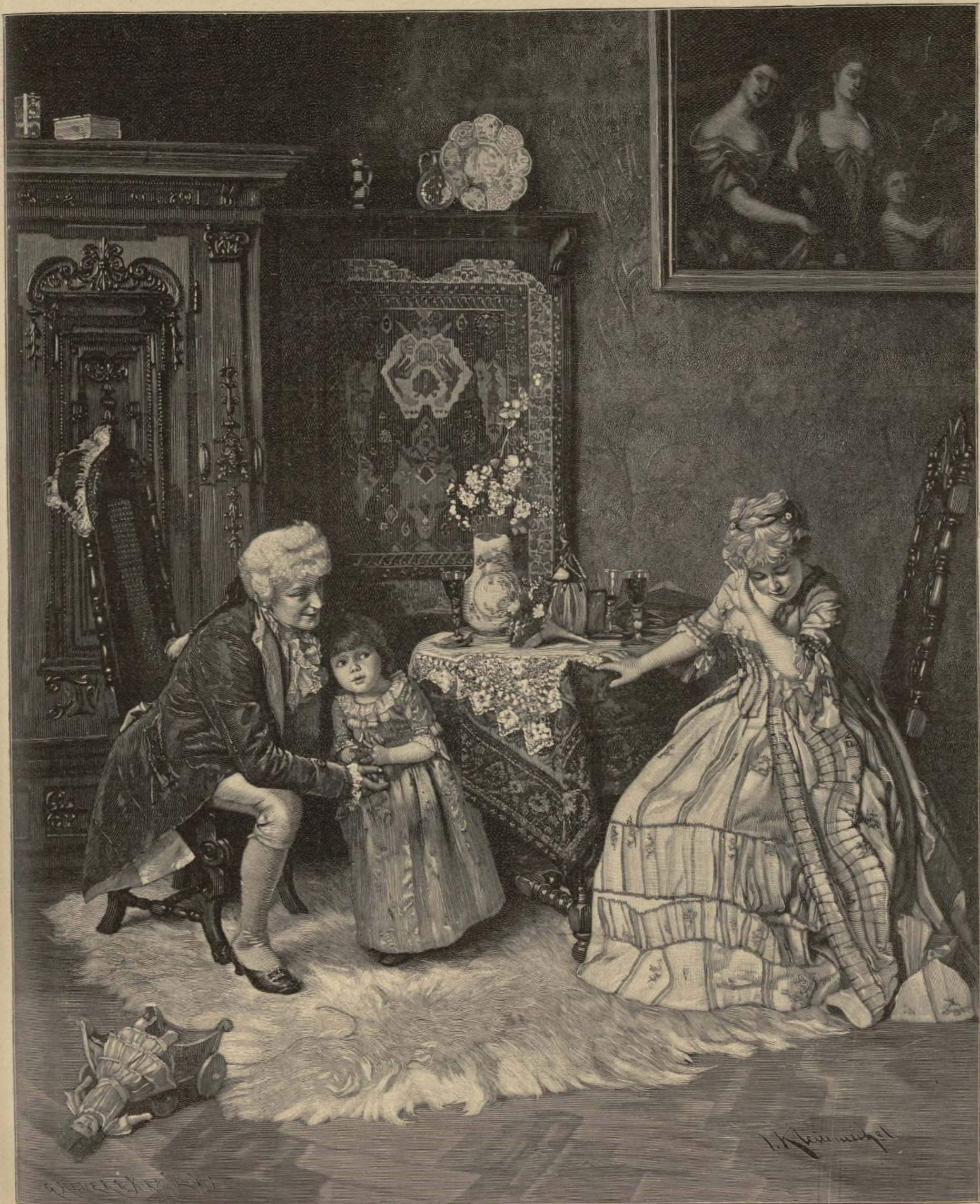
Plaudertäschchen. Von J. Kleinmichel. — Siehe Seite 55.