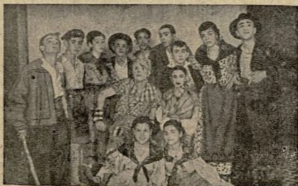
CURVA SE PRESENTA AL PÚBLICO EN UN TEATRO MADRILEÑO Y OBTIENE UN BRILLANTE TRIUNFO