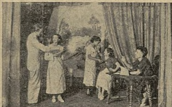
CURVA ENSAYA ¡TIENE ESPÍRITU...!