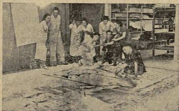
CURVA PINTA SUS DECORADOS. UN RETOQUE AL TELÓN