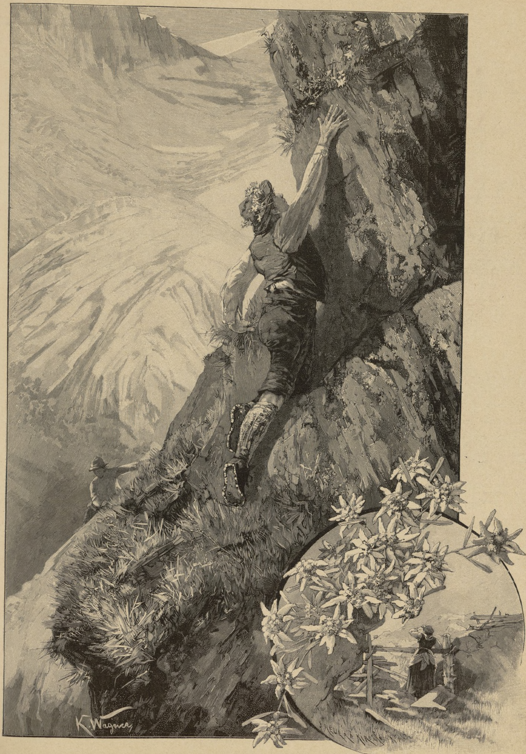
Edelweiss. Von K. Wagner. — Siehe Seite 80.