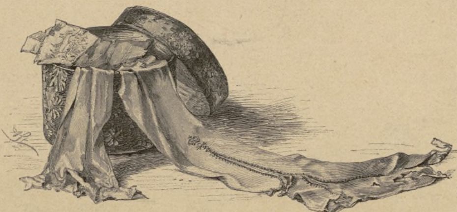
Seidener Strumpf der Königin Marie Antoinette, von ihr während ihres Aufenthaltes im Temple getragen. Der Fußtheil zerrissen.

Dicht bei den Todten kamen sie vorüber, im Sturm-