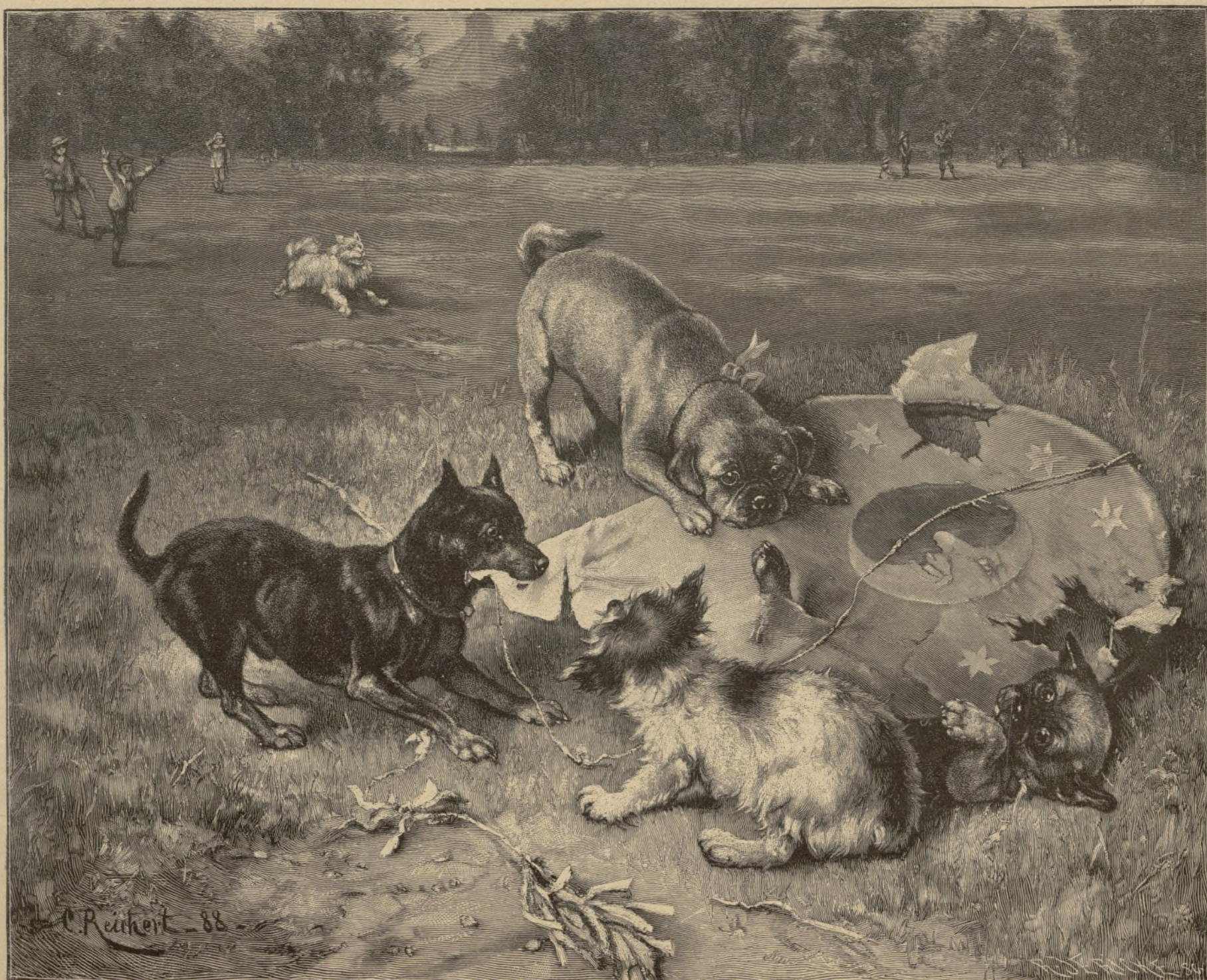
Der Kampf mit dem Drachen. Von G. Reihert. — Siehe Seite 80.

Auf eifriges Zureden der Nachbarinnen entschloß sich die Mutter, Silomela, deren Eltern gestorben waren, auf das Feld zu begleiten. Flavia sah zu, wie die geputzten Frauen und Mädchen über den Platz gingen, ein langer, fröhlicher Zug. Mit welchem der Mädchen würde er heute Abend wohl am meisten tanzen? Mit der Schönsten natürlich! Als die Letzten vorbei waren, begab sich Flavia vor das Haus, wo es ganz einsam