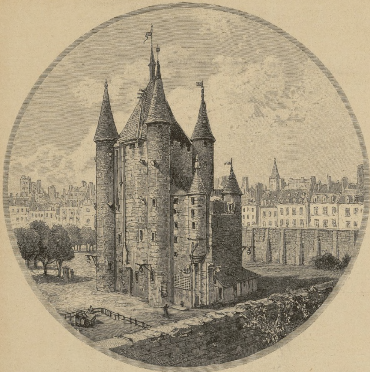
Der Temple zu Paris, das Gefängniß der Königin Marie Antoinette, im Jahre 1793. Von der Ostseite gesehen.

an seinem Herzen; sie hörte seine Stimme, zärtlich flüsternd, sie sah sein Gesicht mit leuchtenden Blicken auf das des Weibes herabgeneigt, das bleich und verklärt war. Oben blieben die Beiden stehen, und das Weib zog einen Ring vom Finger und warf ihn in die Tiefe zu ihren Füßen, schleuderte ihre Treue und ihre Scham in den Abgrund hinein. —