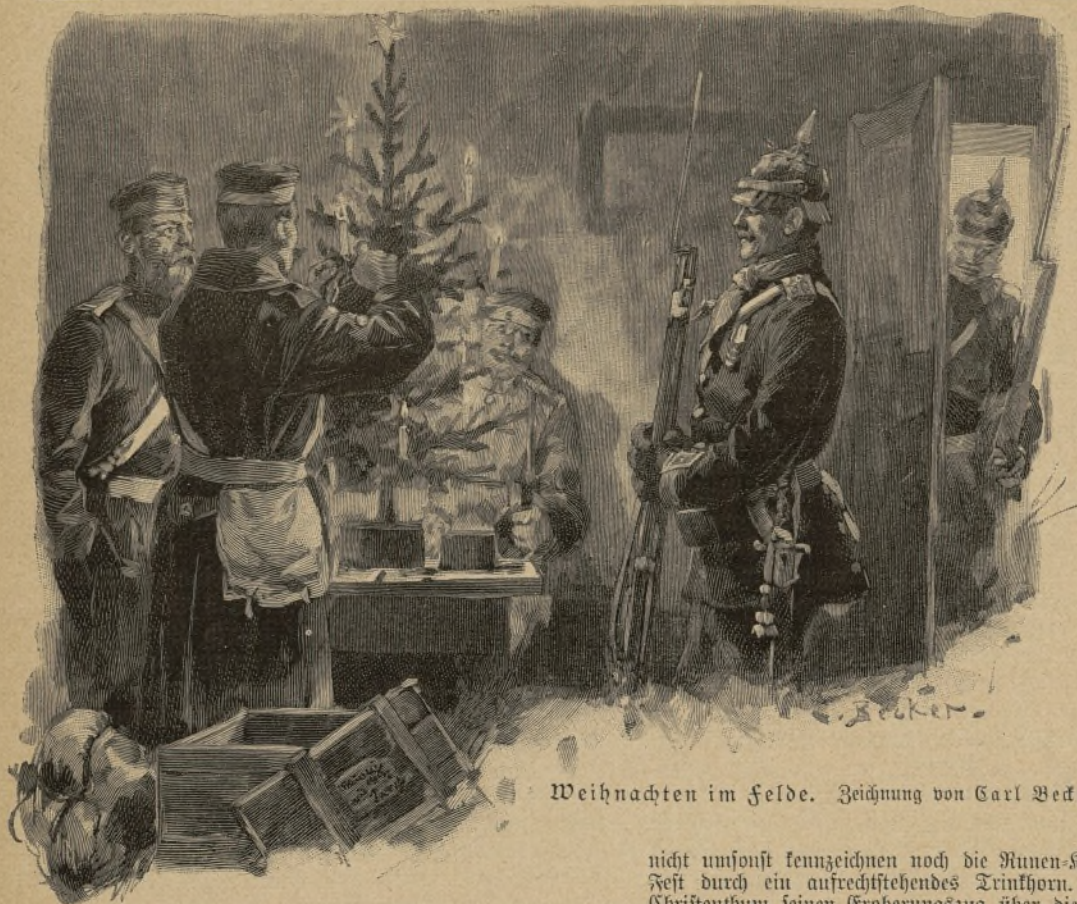
Weihnachten im Felde. Zeichnung von Carl Becker.

die höchsten Triumphe deutscher Machtentfaltung gesehen, fühle ich mich zu sehr als Glied meines großen Vaterlandes. Ich diene freudig dem alten Heldenkaiser und harre mit gleicher Freudigkeit auf den Ruf des jungen. Mit solchen Gefinnungen kann man nicht als Franzose leben! Auch gilt das Wort: „Das Weib folge dem Manne!“ Willst Du mich allein ziehen lassen, Claudine?“