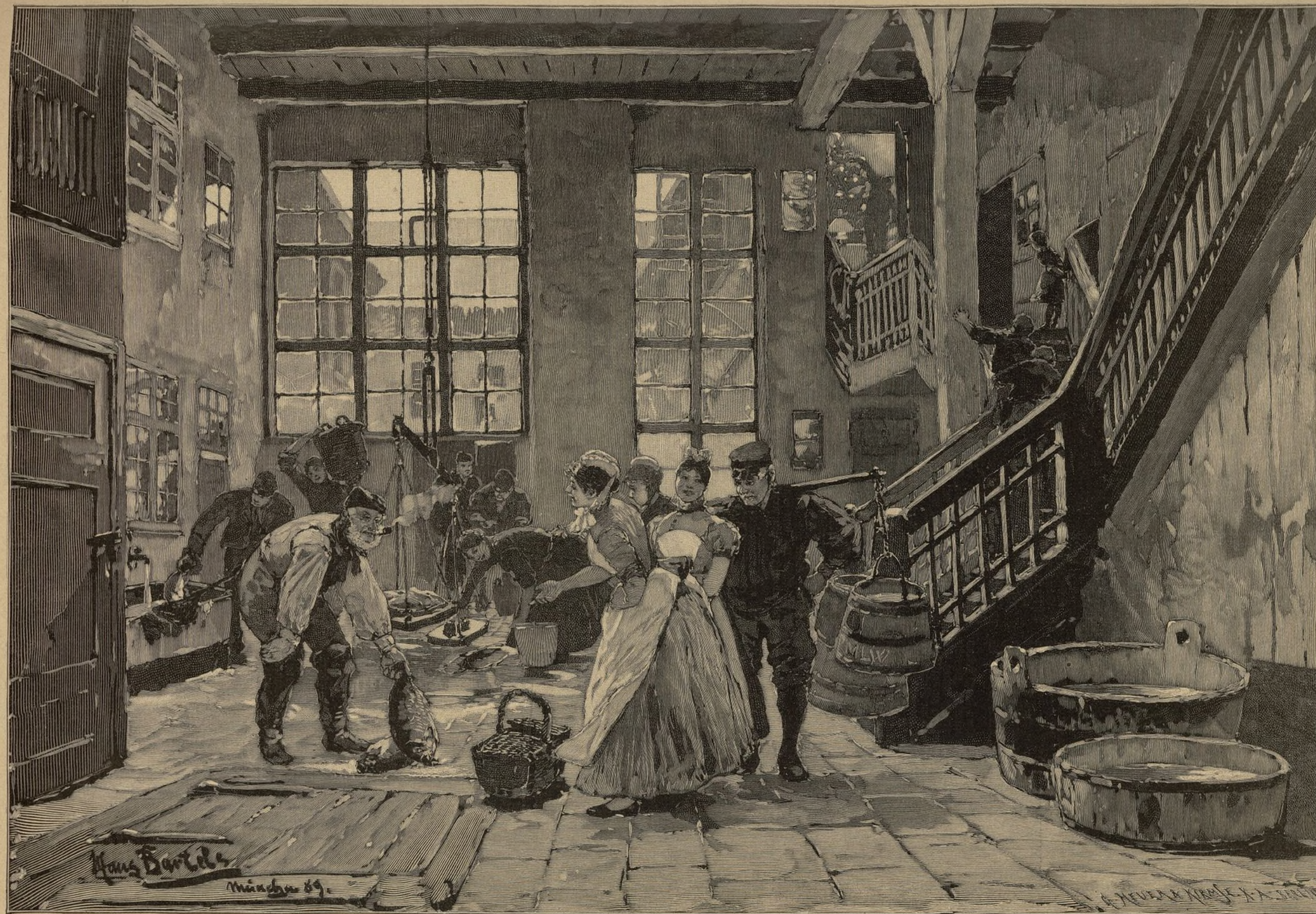
Einkauf des Weihnachtskarpfens. Von Hans Bartels. — Siehe Seite 222.