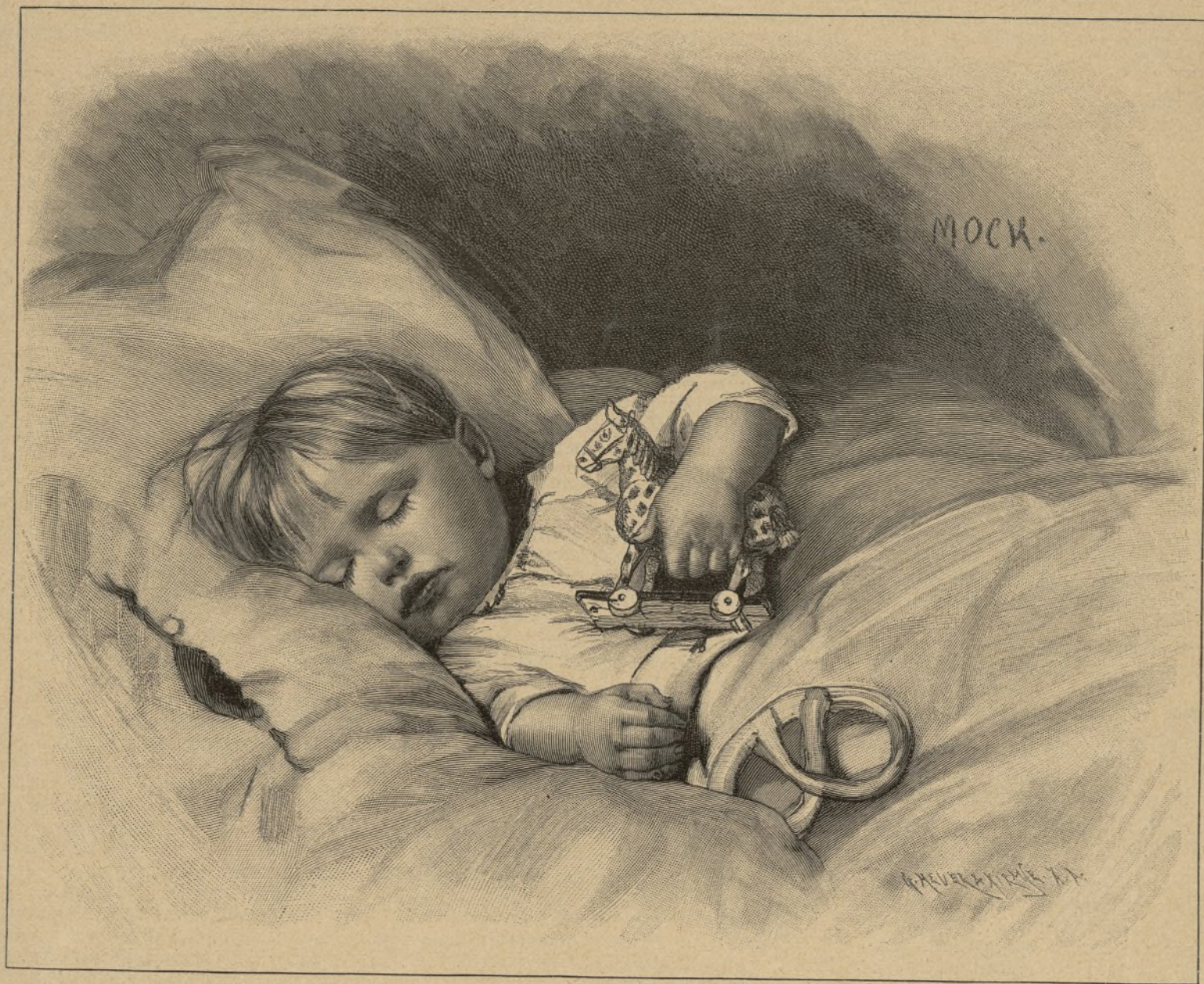
Am Weihnachtsmorgen. Von E. Mock. — Siehe Seite 223.

Die beiden Deutschen sahen einander verwundert an, Keiner von ihnen hatte eine Ahnung gehabt, daß die französischen Reisegenossen das deutsch geführte Gespräch verstanden hatten. Obgleich man gegenwärtig in den Schulen auf den deutschen Unterricht großen Werth legt, macht eine allgemeine Kenntniß der deutschen Sprache doch nur langsame Fortschritte und beschränkt sich eigentlich nur auf die Jugend. Die späteren Lebensalter ver-