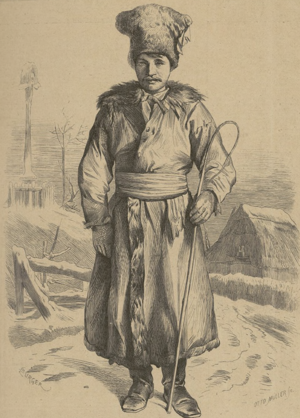
Polnischer Bauer in Wintertracht. Aus der Umgegend von Warschau.