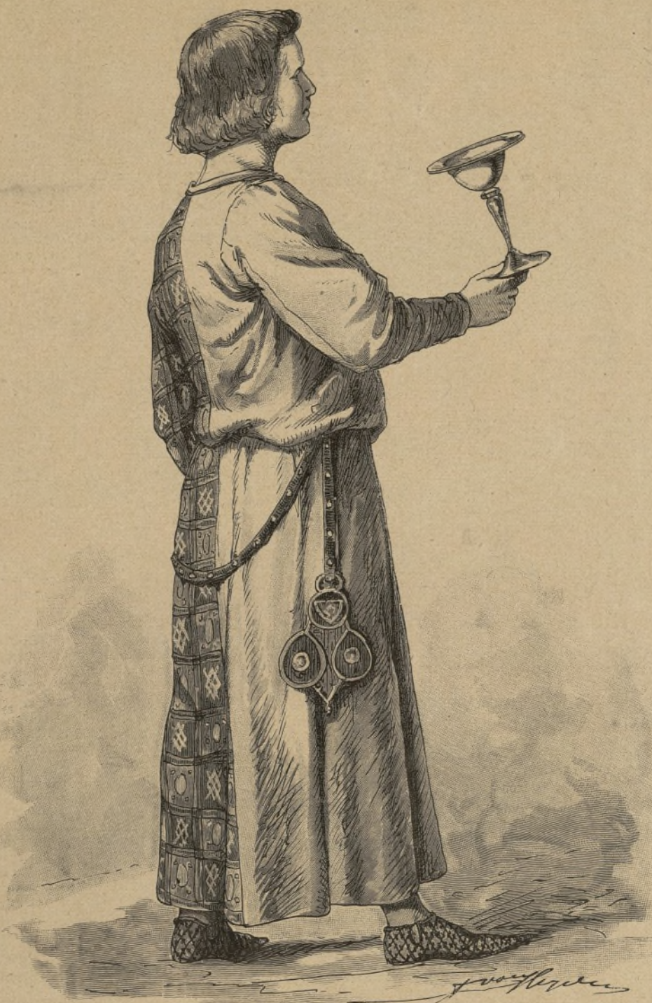
Italienischer Jüngling. Um 1340.

15. December 1889. — XVI. Jahrg., Nr. 51.