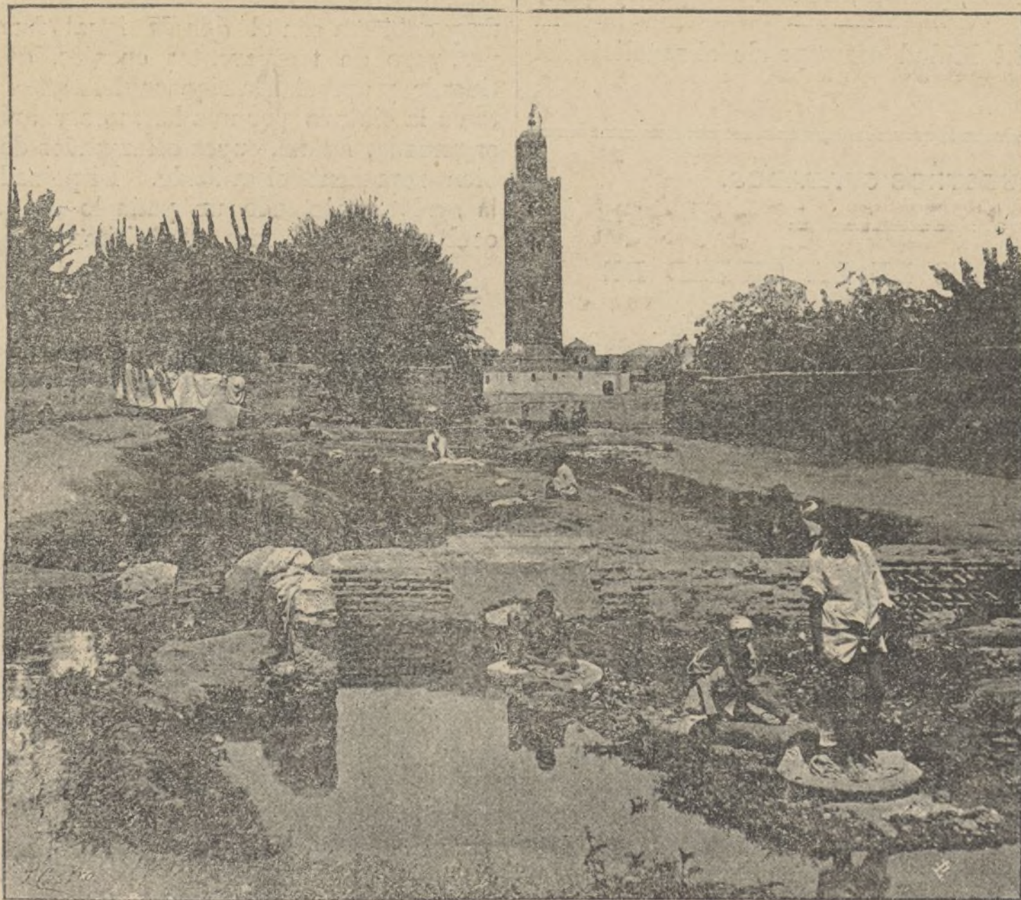
ALREDEDORES DE LA CIUDAD DE MARRUECOS, Y LA KUTUBIA.