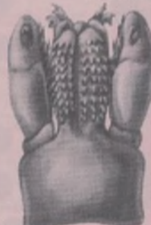
PIEZAS BUCALES DE IXÓDIDO (CARA VENTRAL)