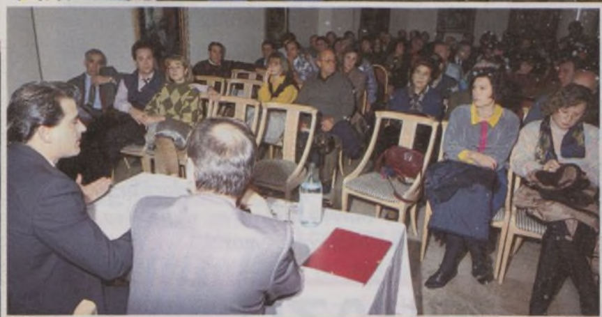
Reunión en el Hotel Rafael Pirámides (31/1/96)