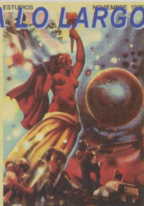
El precio de nuestro heroico sacrificio será la libertad y el bienestar del mundo

Es importante aclarar que ninguna de aquellas mujeres tenían ningún familiar en la expedición hacia África y que tan sólo era un espontáneo acto de solidaridad contra la imposición a la guerra. Claro, que toda esta solidaridad se acabó en el año 1.923, con el golpe de estado del general Primo de Rivera, cuya dictadura fue de trágicas consecuencias para todos los movimientos obreros, entre ellos, por supuesto, los de las mujeres trabajadoras.