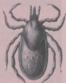
IXODEX RICINUS (HEMBRA)