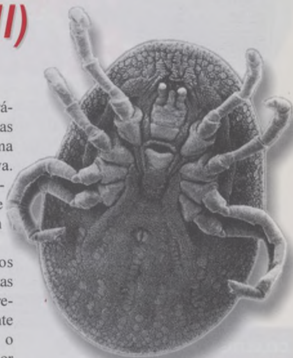
ACARO DEL POLVO