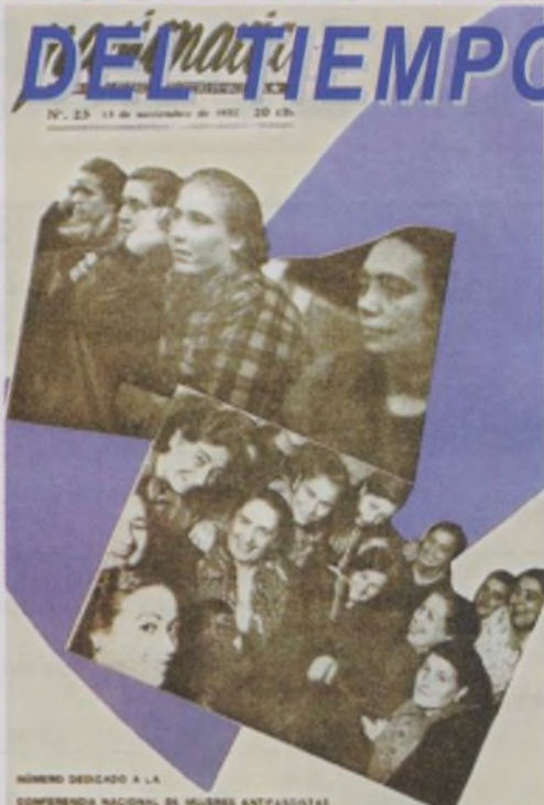
NÚMERO DEDICADO A LA COMPAÑERÍA NACIONAL DE MUJERES ANTI-FASCISTAS