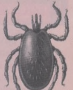
IXODEX RICINUS (MACHO)