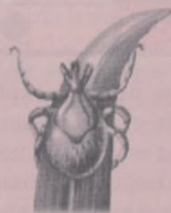
LARVA DE IXÓDIDO, EN ACTITUD DE ESPERA