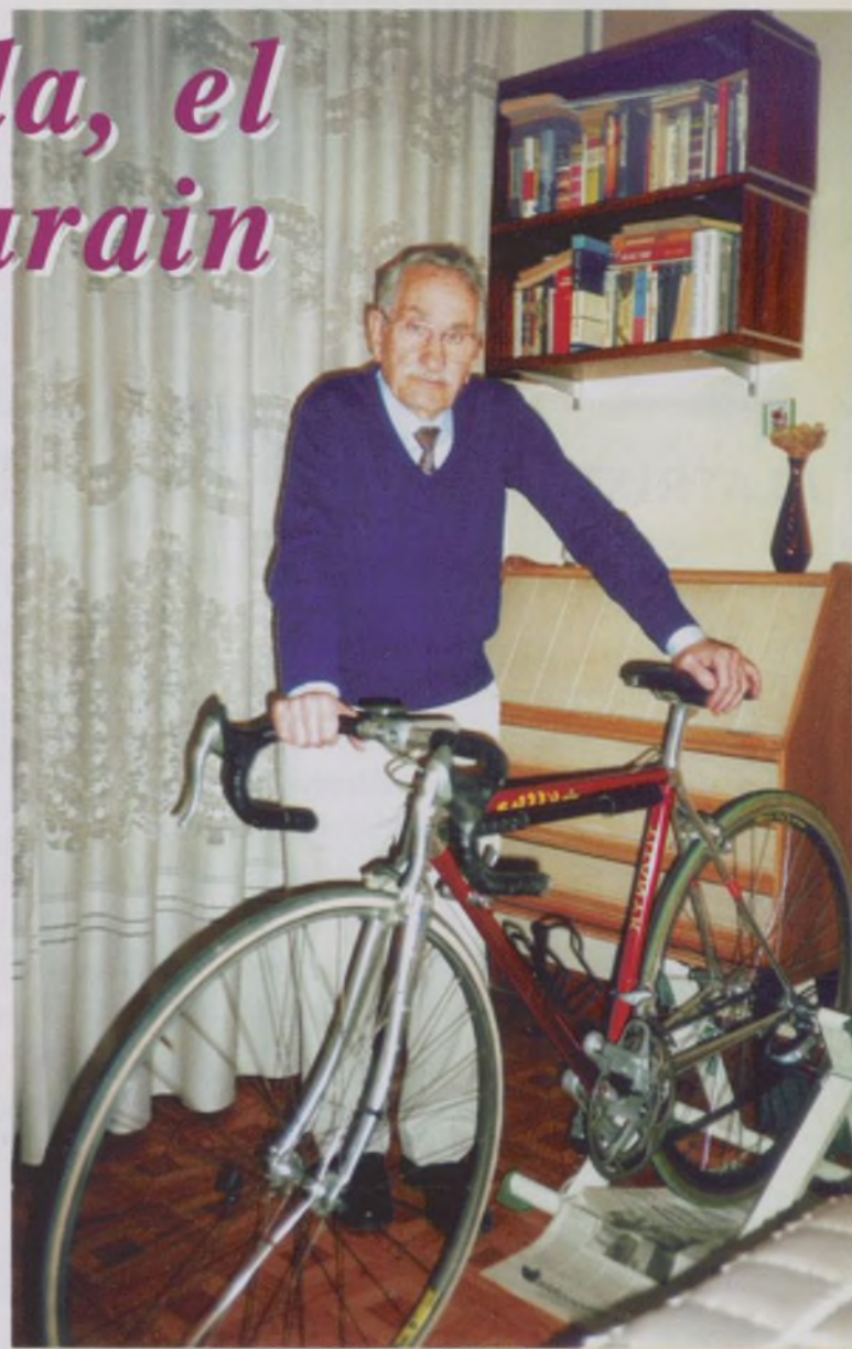
"Si no podía entrar con mi bici, me iba a dormir a otro hotel"