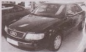
AUDI A-6 TDI 140 cv (Año 96) FULL