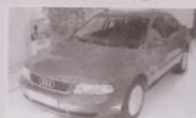
AUDI A-4 TDI FULL (Año 96)