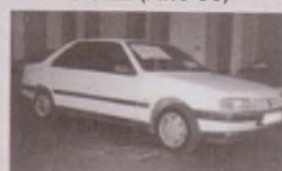
PEUGEOT 405 SRDT (Año 90) FULL