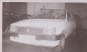
OPEL CORSA SWING (Año 90) 350.000 pts