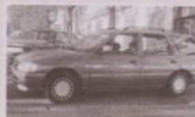
FORD ESCORT 1.8 16V GHIA NÓMADA (Año 92)