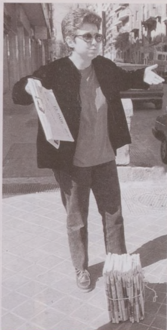
Portada de "La Opinión" nº-49 de Abril del 97 en la que se pedían contenedores de papel para el barrio