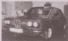
BMW 520 C 4P (Año 82) 375.000 pts