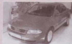
AUDI A-4 TDI FULL (Año 96)