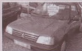
PEUGEOT 205 5P (Año 92)