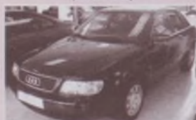
AUDI A-6 TDI 140 cv FULL (Año 96)