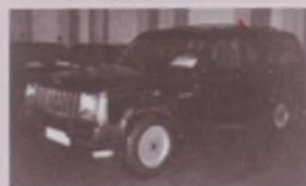
JEEP CHEROKEE 2.1 TD FULL EQUIPE (Año 90)