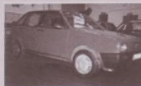
SEAT IBIZA 1.5 (Año 90)