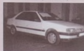
PEUGEOT 405 SRDT FULL (Año 90)