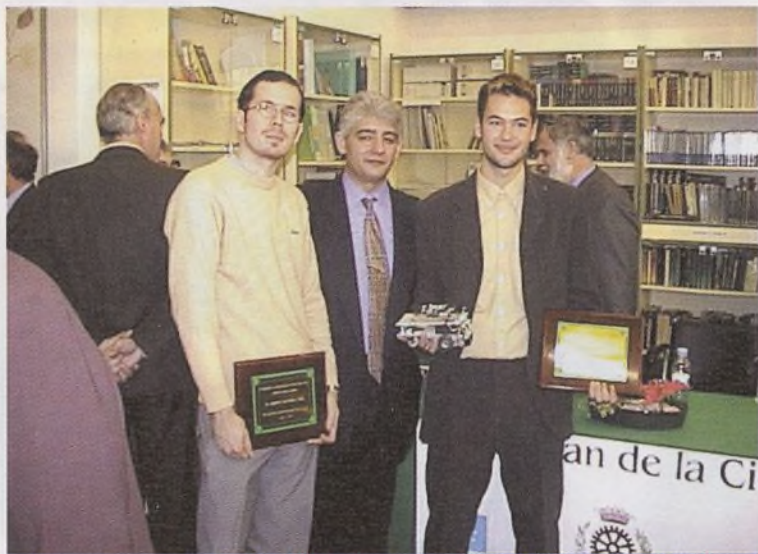
Entrega del premio en la Biblioteca "José Hierro" de nuestro Instituto

Hoja Web: http://www.arrakis.es/~ies.juan.de.la.cierva