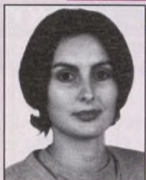
Diplomada en Dietética y Alimentación Humana