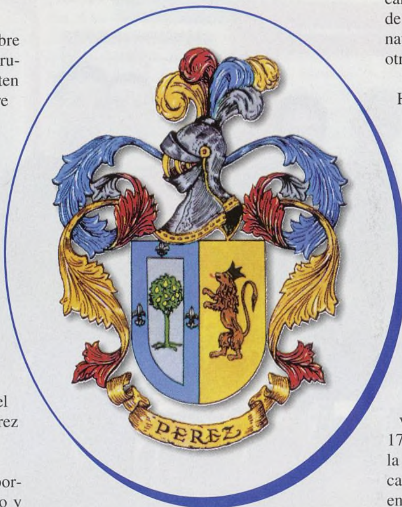
Pilar del Pozo Yuste

Sus armas: escudo partido, primero con bordura de azur con tres flores de lis de oro y