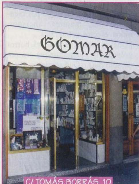
C/ TOMÁS BORRÁS, 10