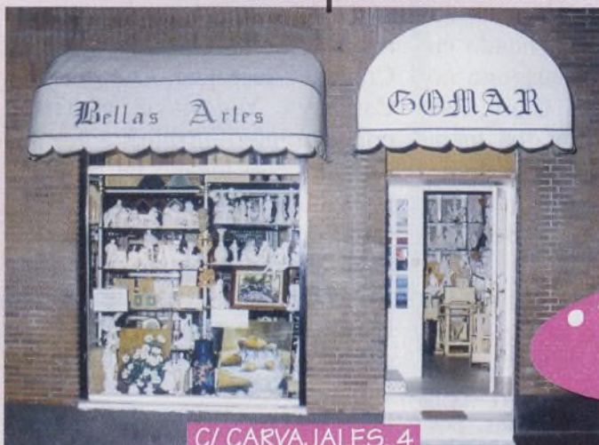
C/ CARVAJALES, 4