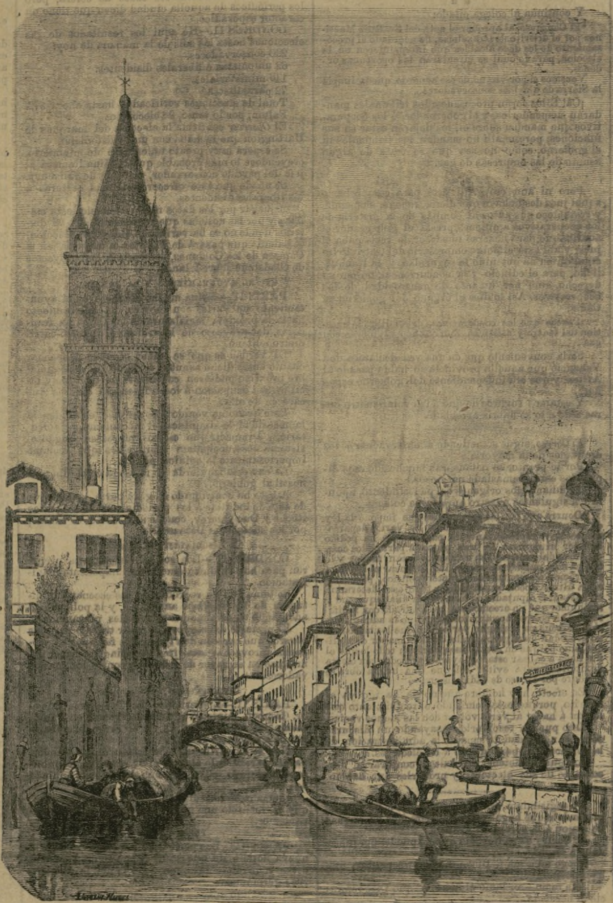
Canal Orfano en Venecia.