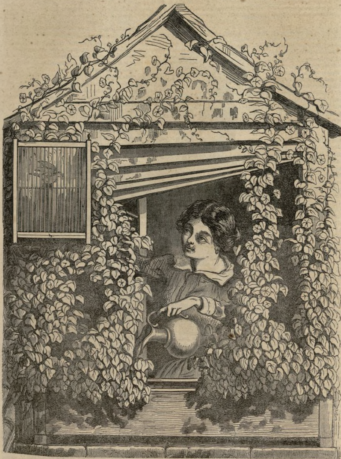
PUREZA. — FELICIDAD.

La lámina anterior es un mero capricho de artista; una sencilla, pero graciosa escena de inocencia y de bien estar. La pintoresca perspectiva del terrado de una casa de aldea, por cuyo frente trepan caprichosamente algunas plantas de enredaderas sobre las cuales se distingue la jaula en que una paloma bate alegremente las alas al ver á