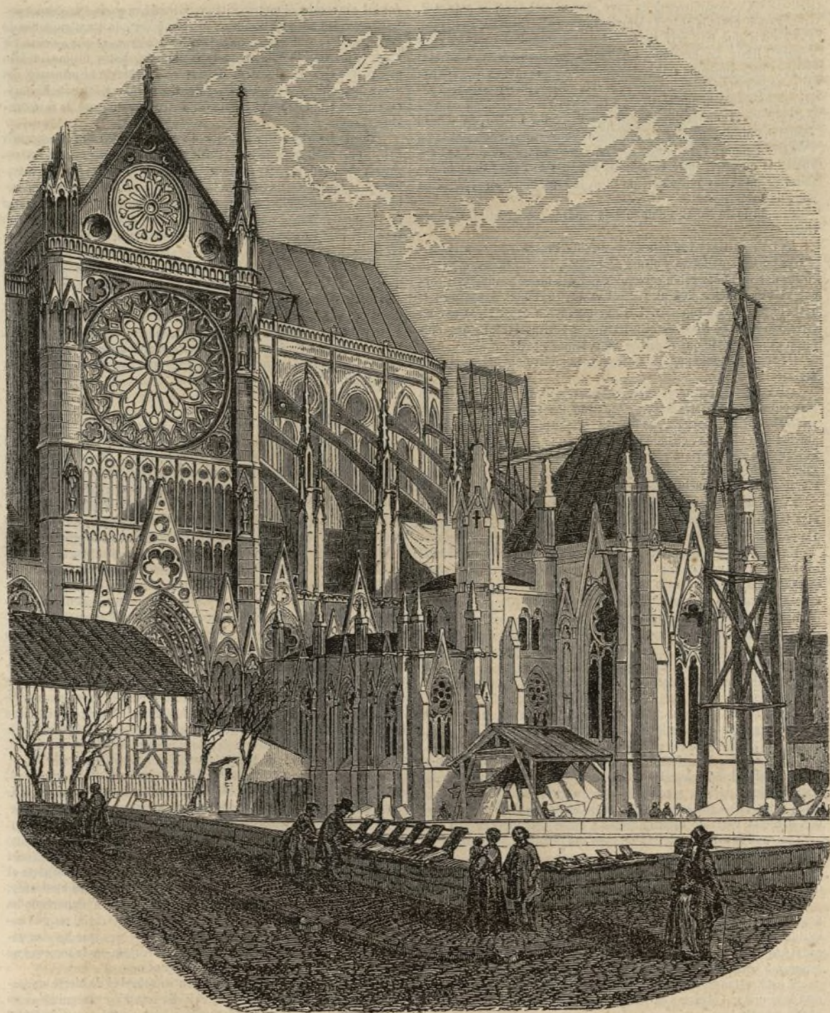
NUESTRA SEÑORA DE PARIS.

Nuestra Señora, iglesia catedral de París, está situada en la estremidad oriental de la isla de la Cité. Mauricio de Sully, un pobre hijo del pueblo, que por efecto de las circunstancias se elevó á la dignidad de obispo, fué el que emprendió la reedificación completa de la iglesia metropolitana de París. Los trabajos empezaron en el año de 1163. En 1182 fué consagrado el altar mayor por Enrique, legado de la Santa Sede.