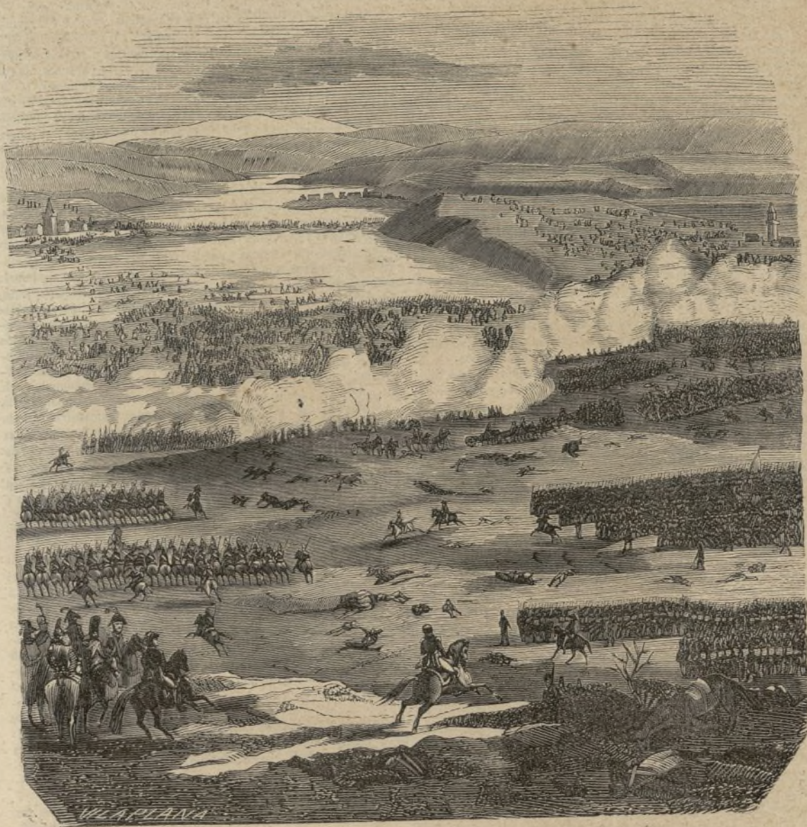
LA BATALLA DE AUSTERLITZ.

A pesar de ser tan conocido este brillante hecho de armas del primer guerrero de nuestro siglo, daremos una leve reseña de él para la mejor inteligencia de la lámina que ofrecemos hoy á nuestros lectores.