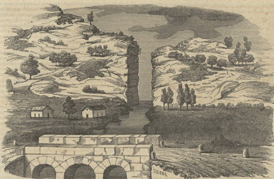
PASO DEL ULLA EN SAN JUAN DA COVA.