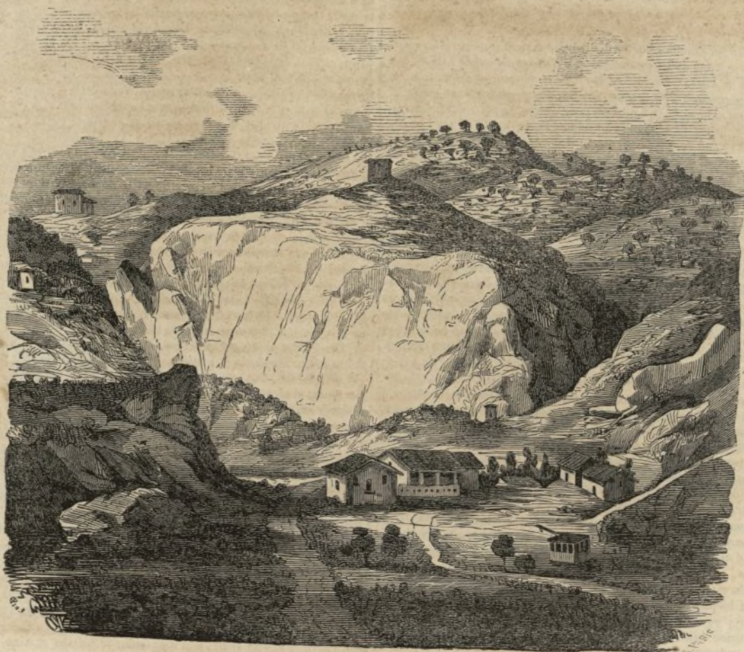
LAS SALINAS DE CARDONER, VISTA TOMADA DESDE EL PUNTO LLAMADO LAS GUIXERAS.

La parte del mineral de las salinas de Cardoner en que se vé la sal descubierta, tiene media legua de estension, y de ancho sobre un cuarto de hora; pero teniendo en cuenta las señales que existen, tanto en la montaña como en sus alrededores, no se puede calcular hasta dónde puede llegar la sal, pues se manifiesta en la parte del Cierzo en la Coma, que dista del mineral once horas, en cuyo punto tiene principio el río Cardener, que pasa por debajo de las salinas con direccion á Suria; en épocas de trastornos, á un tiro de fusil del nacimiento del río se ha sacado sal de piedra. A las vertientes de la Coma y pueblo de Cambrils, distante dos leguas escasas, hay una fuente abundante de agua salobre, que se calcula sea procedente del mineral de la Coma; y por la parte del Mediodía en Suria, que dista unas cuatro horas, hay otra mina de sal á la orilla del río, siendo de advertir que es de buena calidad y produce cristales como la del mineral. La montaña del Castillo por la parte de Levante se halla situada encima de la sal, tanto que en el día para construir la carretera que pasa por debajo del castillo á la orilla del río, se ha tenido que quitar una gran porcion de sal para hacer el firme, y aun así en épocas de mucha humedad padecerá, pues una beta de la misma pasa por el río. Sin embargo, en nada puede perjudicar al castillo y su montaña por tener éste una media legua de elevacion.