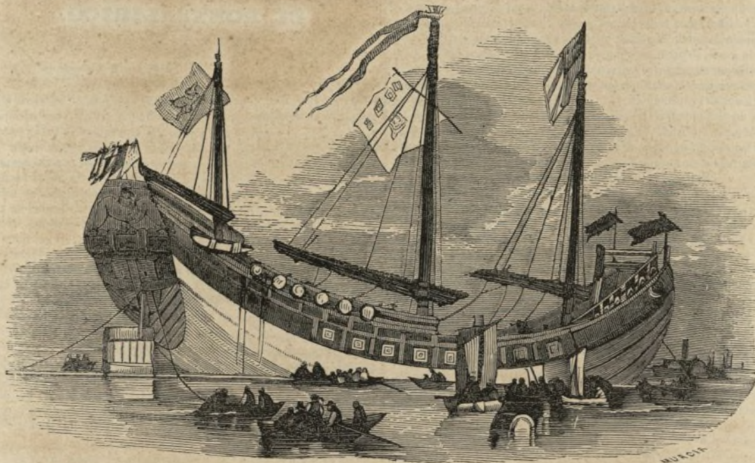
Exterior del junco chino.

mayores precauciones, tanto para comprarle como para traerle. Sin embargo, ningún obstáculo pudo retraer á estos señores: perseveraron en su intento, y un éxito feliz coronó sus esfuerzos. Los chinos parecían tener una repugnancia insuperable á salir al extranjero con