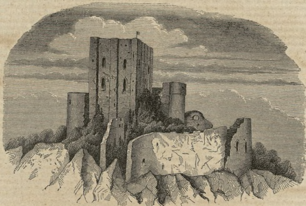
(Ruinas del castillo de Monfrichard.)