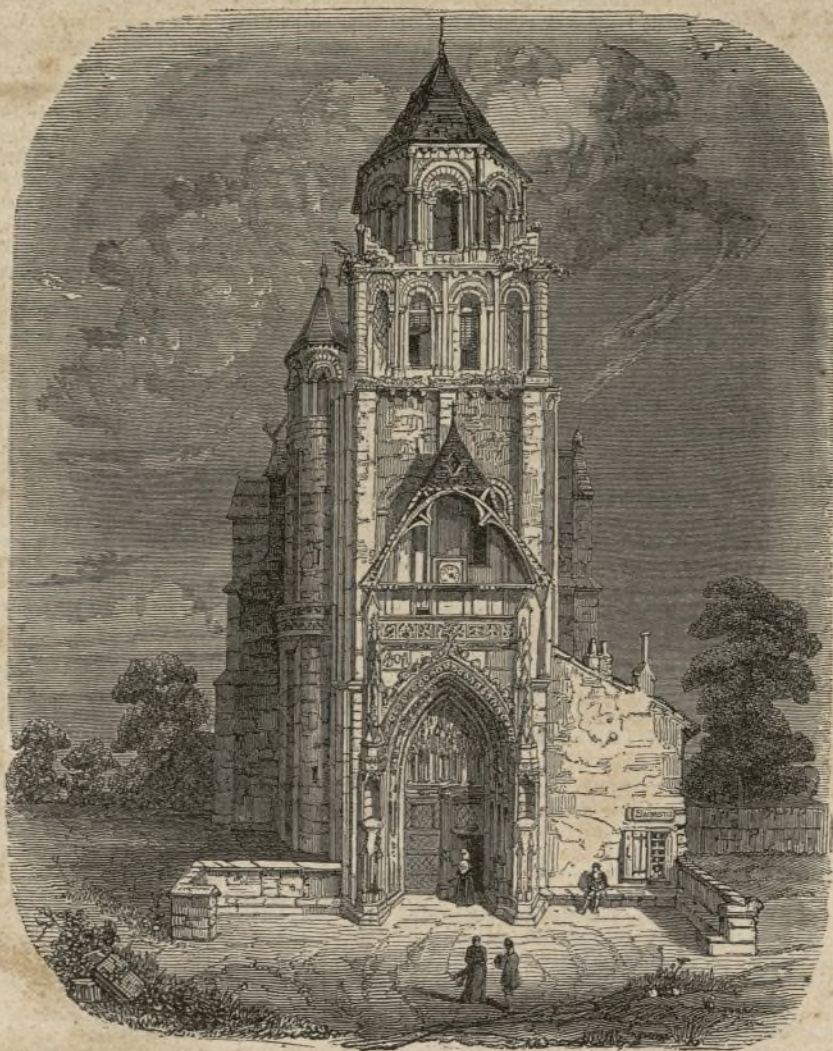
IGLESIA DE SANTA RADEGUNDA EN POITIERS.

Santa Radegunda es una de las santas á quienes se venera con mas devocion en Poitiers; damos hoy á nuestros lectores el grabado de la iglesia que se la ha consagrado. Hé aqui la descripcion que hacia de ella Thibaudau antes de la publicacion de su historia del Poitou.