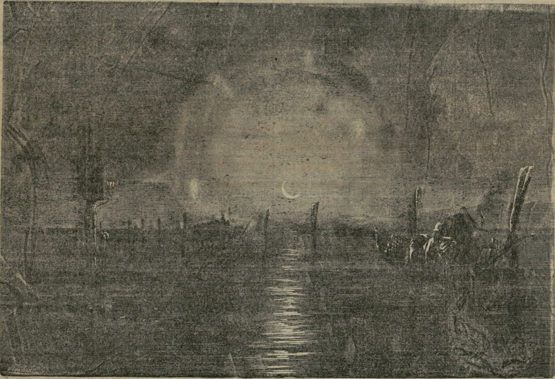
Una vista de Venecia.