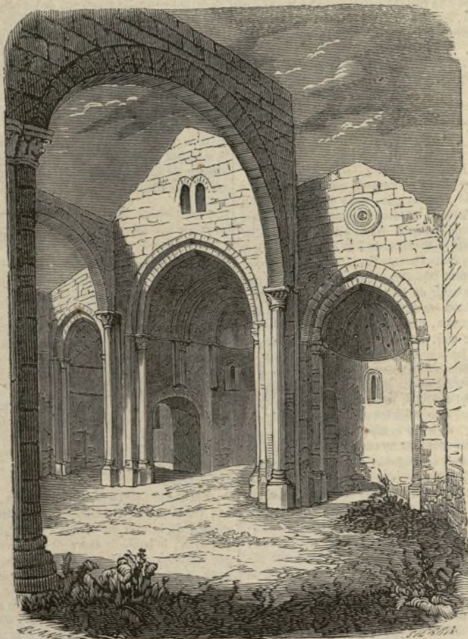
(Interior de la antigua iglesia de Uceda.)