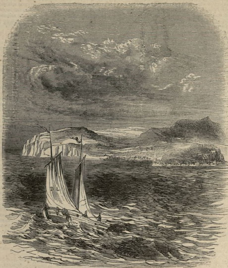
VISTA DE LA ISLA DE ELBA.