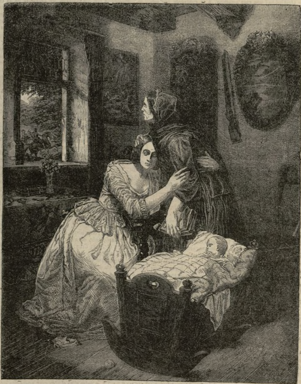
LA ABANDONADA, CUADRO POR CARLOS HUEBNER.

Ya desde los primeros días que fué creada nuevamente la escuela de pintura de Dusseldorf, ciudad de los estados prusianos, hizo célebre Huebner. Su cuadro La ondina, Rolando que liberta á la princesa , y La Madona , son testimonios incontestables de sus dotes de artista eminente. Cuando en 1814 vió el público el precioso lienzo de Los tejedores de Silesia , cuadro característico, admiró todo el mundo cómo tan inesperadamente había pasado á este género, tan opuesto al que antes se había dedicado, y en cuya producción ha sabido unir admirablemente á la sencillez de la verdad la más vigorosa entonación.