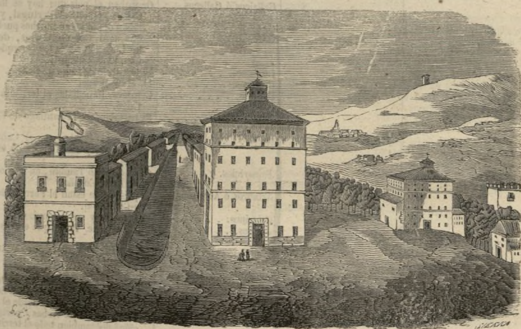
(Muelle del Canal de Campos.—Véase la página 202.)

Podéis negarlo si no habeis tenido ocasión de verlo. Enhorabuena! Esplícadme pues este hecho. El mismo cuadro de la administración de