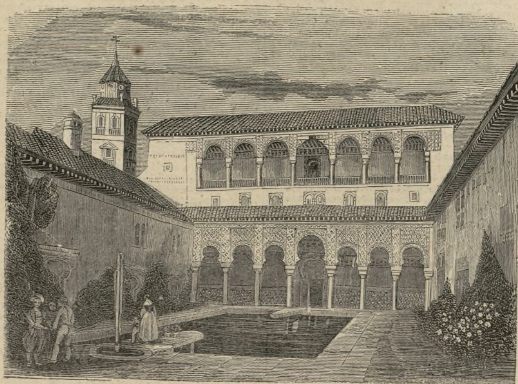
(Patio de los arayanes en la Alhambra.)

Asia á un lado, Al otro Europa Y frente á frente Stambul.