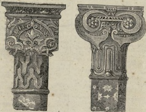
(Detalles de capiteles.)

Otro si defendemos, y mandamos, que ningun coche, ni litera se pueda hazer bordado de oro, ni de plata, ni de seda, ni aforrado en brocado, ni tela de oro, ni de plata, ni de seda alguna que lo tenga, ni con franjas, ni trencillas, ni otra guarnicion alguna de oro, ni de plata, y que solamente se puedan hazer de terciopelo, ó otro qualquier