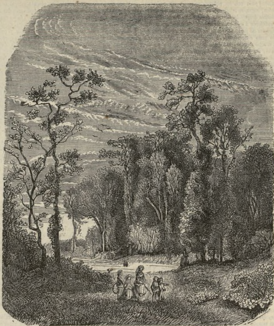
EL BOSQUE DE BOULOGNE EN PARIS.