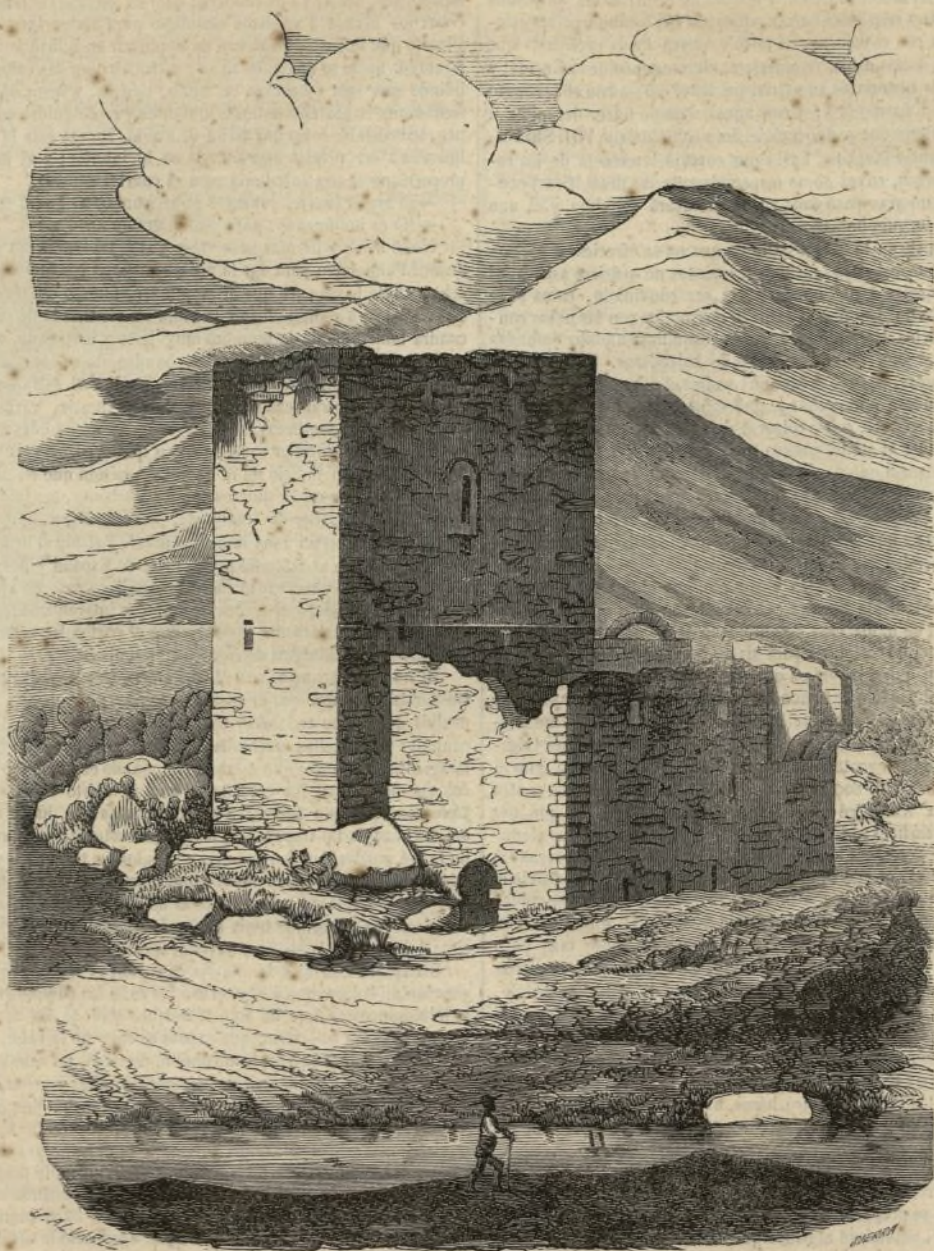
CASTILLO DE VILLAVERDE EN LUNA.

A distancia de una legua y hacia el N. de la villa de Luna, encuéntrase este castillo y parte de su antigua fortaleza llamada de Villaverde; siendo su situación en un pequeño valle á la margen derecha del río Arba de Biel.