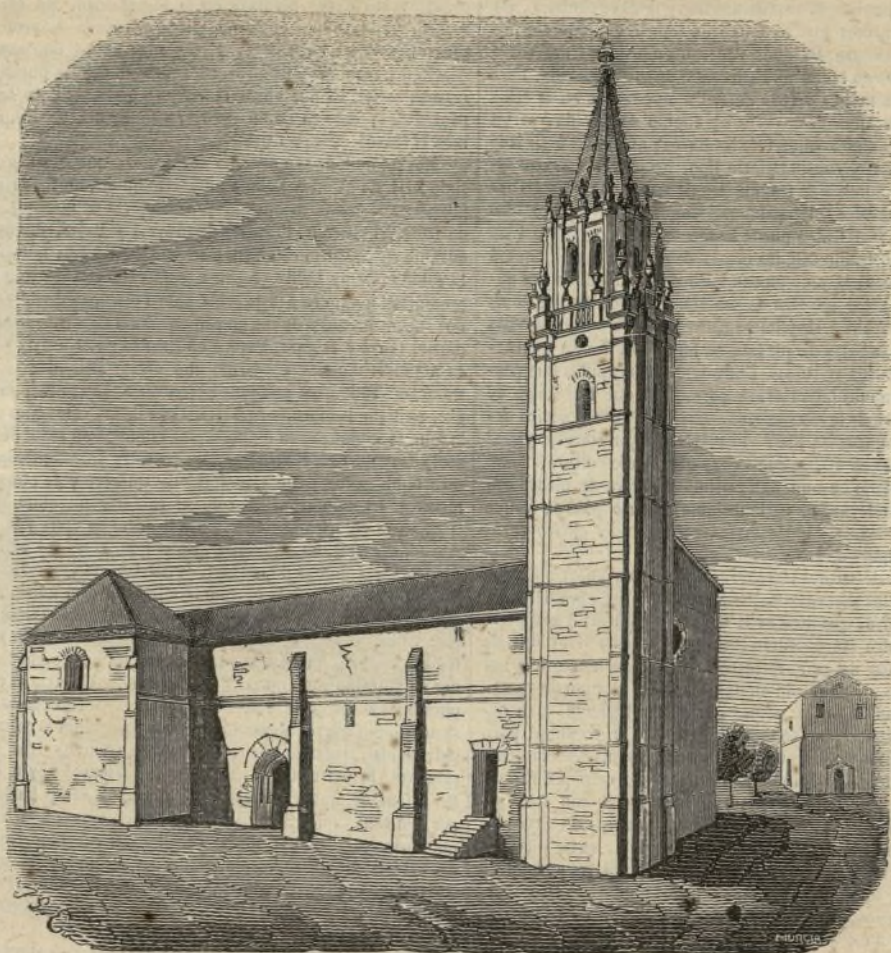
LA COLEGIATA DE AMPUDIA.