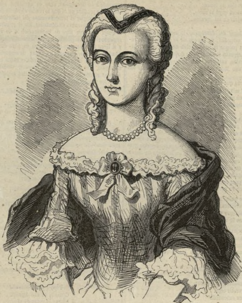
LUISA DE LA VALIERE.