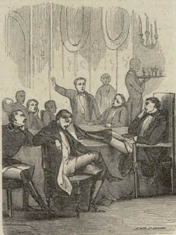
(Aventuras de un loco coronado.)

Entra en mi plan higiénico la facilidad con que me resuelvo á creerlo todo y de algunos dolores de cabeza me he librado desde que dejé de cavilar sobre estas ó las otras materias. Oyen algunos campanas y no saben donde: cuando oigo yo una campana ya sé que da en la torre. Dice un autor, de cuyo nombre no quiero acordarme, que es de vidrio la mujer, y yo creo lo que dice el tal autor; pero como no hay regla sin excepcion, creo tambien que las espaldas de la mujer de un zapatero que hay en el portal de mi casa son de piedra