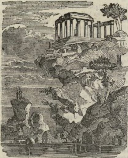
(Templo de Minerva.)

Por los tratados de paz que en el siglo pasado se hicieron con Por-