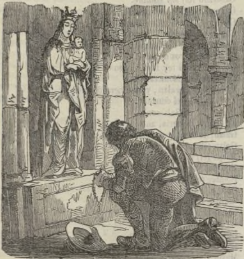
(Estatua de la Virgen de Ntra. Sra. de Montserrat.)

tugal, se cedió la propiedad de estas islas á la corona de España. El