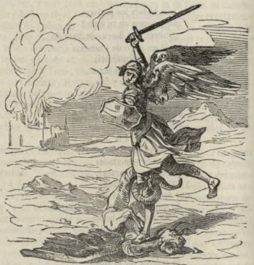
(San Miguel.—Cuadro de Rafael.)

relacion será tanto mas instructiva y digna de atencion, cuanto que es-