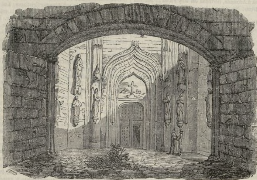
(Fachada principal de Santo Tomás.—Ávila.)

En los estudios investigadores que ofrecen á la curiosidad pública las crónicas antiguas, no deja de encontrarse interés en muchas de ellas, pues nos revelan, cuando menos, que la época en que se levantaron mas conventos en España, fué indudablemente en el reinado, por muchos títulos memorable, de los Reyes Católicos D. Fernando y Doña Isabel I. Esta gran reina, dotada de un talento claro y de un fondo religioso sin hipocresía, quiso dejar sus mayores glorias consignadas para perpetua memoria en San Juan de los Reyes , en Toledo, San Gerónimo , de Granada, y otros célebres monasterios. Tal es el de Santo Tomás de Aquino , que nos ocupa, el cual, si bien no adquirió el interés artístico de los ya citados, sin embargo es una obra muy notable, y fué uno de los conventos mas nombrados al finar el siglo XV; monasterio, en fin, de grande interes histórico por su riqueza y por las noticias que nos han dejado de él las crónicas.