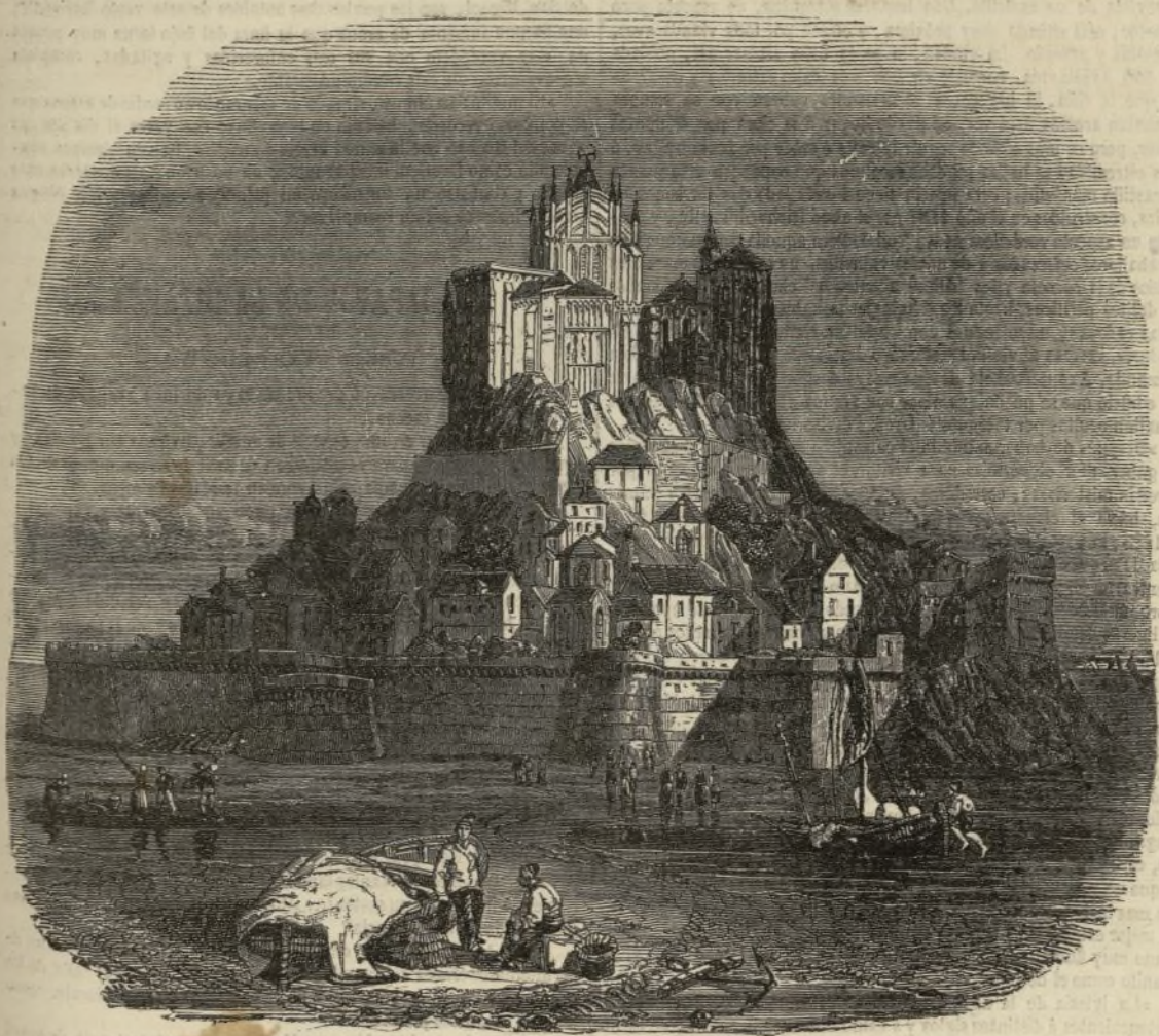
EL MONTE SAN MIGUEL.

Este monte célebre ha dado lugar á muchas y estensas noticias, á las cuales remitimos al lector ansioso de numerosos pormenores; nos contentaremos con dar aquí la rápida reseña que ha hecho de él Monsieur Eduardo, hermano.