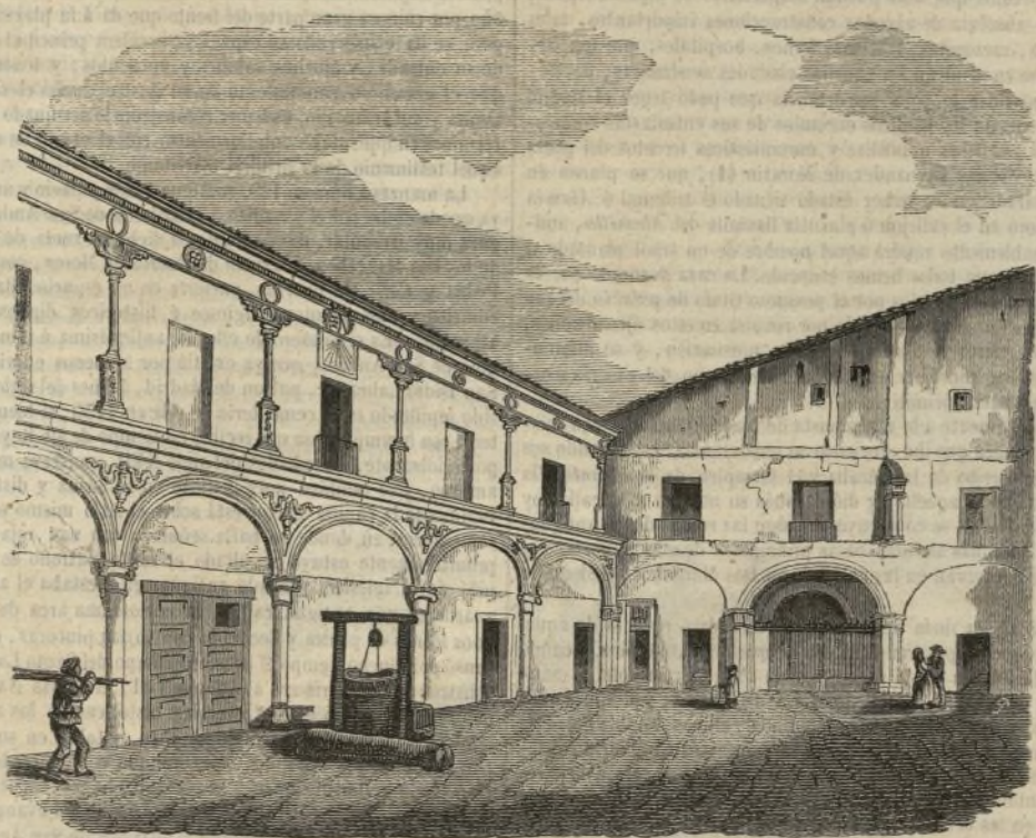
(Patio de la casa de San Vicente.)