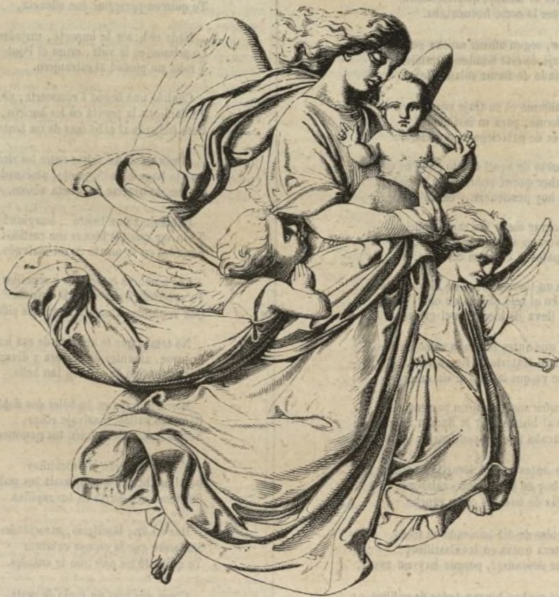
(Relieve de Rietschel.)

Este excelente discípulo de Rauch nació en Pulsnitz, en Sajonia, el año 1804. Su primera educación artística la recibió en las escuelas de dibujo de la Academia de Dresde, desde donde pasó á Berlin con los rudimentos necesarios á fin de continuar sus estudios en el obrador de Rauch, cuya fama llegaba entonces á su punto culminante. No le fué aquí adversa la suerte, pues el maestro, que al primer golpe de vista reconoció en aquel joven entusiasta y despejado una verdadera vocación para el arte, le manifestó un interés extraordinario, no omitiendo