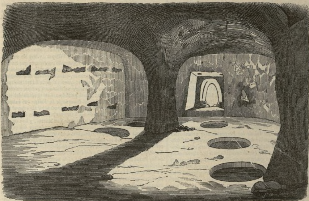
LA PEÑA DE SAN ROMAN.

En un pueblo de la Alcarria llamado Salmeron existe una gigantesca peña colocada sobre las breñas mas escarpadas del país. Ocupa una eminencia considerable, dominando toda la estension de una prolongada vega titulada Vall de Medina, que tiene una altura por igual de mas de 30 varas. Esta gran mole de piedra, conocida por los naturales del país con el nombre de La Peña de San Roman , no ofrece otra cosa de particular desde su descenso, mas que el aspecto de una antigua muralla al Oriente, desmoronada de trecho en trecho, de alguna que otra hendidura, cuya ilusion aumenta con la interrupcion. Como á la altura de 20 á 22 varas se distingue una pequeña tronera de figura ogival que representa tener vara y media de alto por media de ancho. Fundadamente se cree que esta especie de cueva hace muchísimos años que no debe haber sido visitada por persona alguna, ya por lo inaccesible y espuesto de su arribo, ya tambien porque la tradición que los naturales del país han ido transmitiendo sucesivamente de que en dicho peñon existia una temible cueva llamada de la Mora, imponia á los mas decididos, difundiendo el miedo y la supersticion por los pueblitos vecinos.