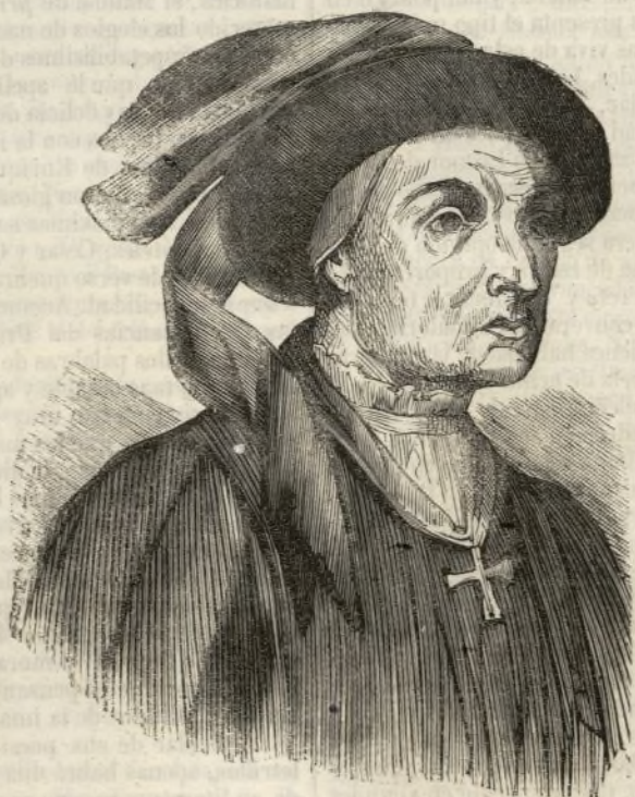
EL MARQUÉS DE SANTILLANA.