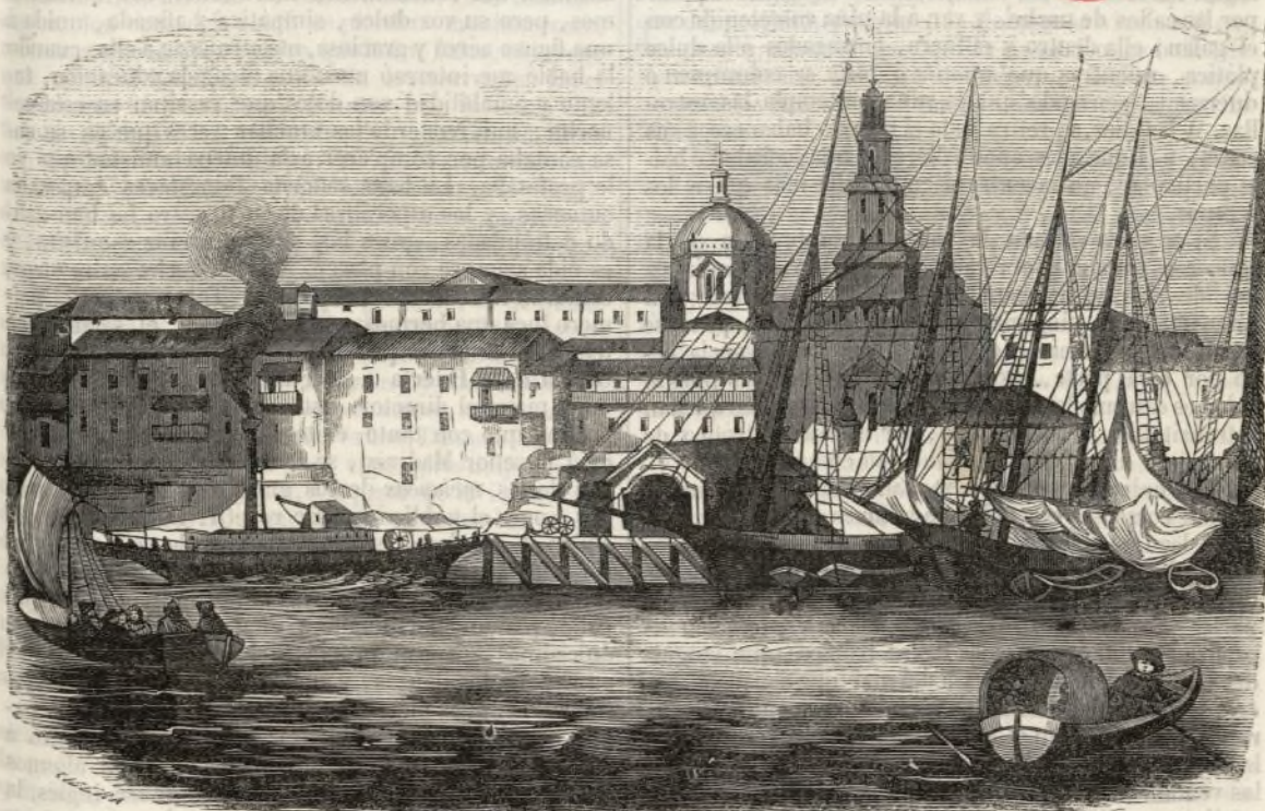
Muelle de S. Francisco en la Habana.