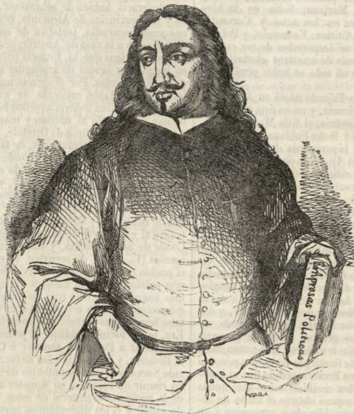
D. DIEGO DE SAAVEDRA FAJARDO.