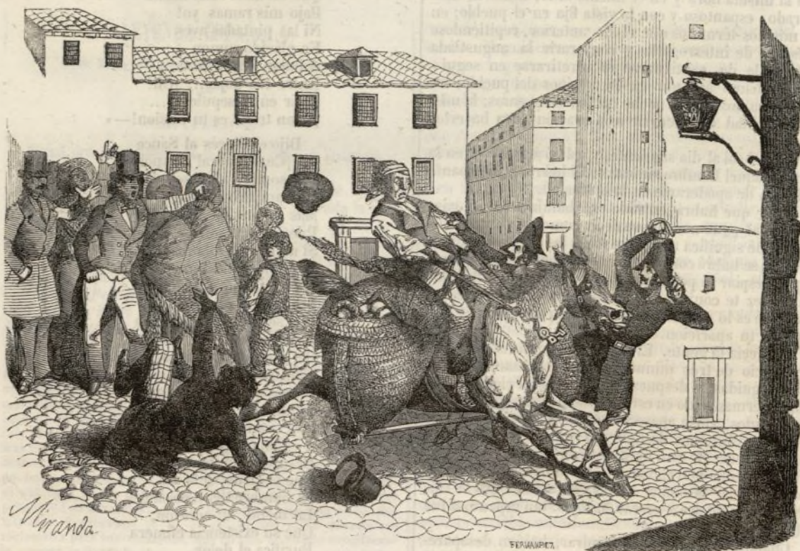
Pronunciamento de un jamelgo de tahona.

Madrid 1847.—Imprenta y Establecimiento de Grabado de D. Baltasar Gonzalez, calle de Hortaleza. 89.