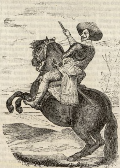
EL CONDE DUQUE DE OLIVARES.

Copia del original de D. Diego Velazquez que existe en el real Museo de Pinturas de Madrid.