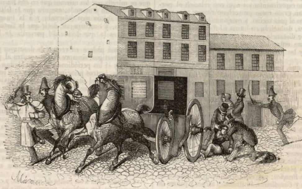
Observancia de los bandos municipales.

Madrid 1847.—Imprenta y Establecimiento de Grabado de D. Baltasar Gonzalez, calle de Hortaleza, n. 89.